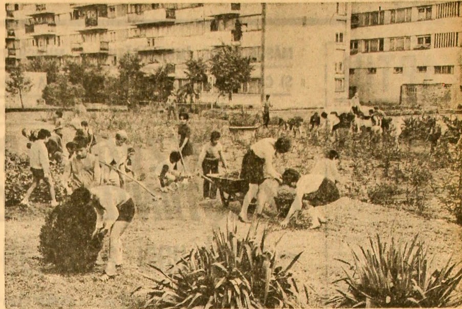
În prima zi a „Săptămîinii muncii patriotice” (Elevi de la Școala generală nr. 56 din Capitală)