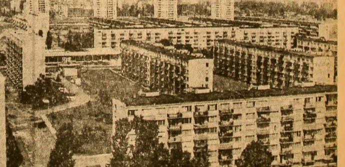
Complexul de locuințe „Borovo” din Sofia