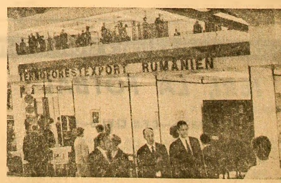
Standul românesc de bunuri de consum de la Tîrgul internațional de la Leipzig cunoaște un aflux continuu de vizitatori. Ieri, el a fost vizitat de ministrul pentru problemele economice externe al R.D.G., Horst Salte, însoțit de adjunctul său, Gerhard Nitschke. După vizitarea standului, ministrul Salte a avut o discuție cu directorul pavilionului în legătură cu dezvoltarea în continuare a schimburilor comerciale dintre cele două țări.

MOSCOVA — Corespondentul nostru S. Podin transmite: La 8 septembrie s-a deschis la Moscova o expoziție internațională de materiale de construcții și utilaje pentru fabricarea acestora, la care participă circa 800 de firme și organizații de comerț exterior din 26 de țări. Tara noastră este prezentă cu un pavilion de 600 de metri pătrați, în care se află expozate reprezentînd principalele grupe de produse ale întreprinderilor Ministerului Industriei Materialelor de Construcții. În același pavilion expune și Ministerul Industriei Chimice un grup de produse pe bază de polimeri cu diferite utilizări în construcții. În aceeași zi, pavilionul României a fost vizitat de I. T. Novikov, vicepreședinte al Consiliului de Miniștri al U.R.S.S., I. A. Grismanov, ministrul industriei materialelor de construcții, și de alte persoane oficiale sovietice. În pavilion, oaspeții au fost întâmpinați de Silviu Opris, adjunct al ministrului industriei materialelor de construcții, prezent la Moscova cu ocazia deschiderii expoziției.