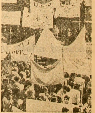
În Trafalgar Square, gridoarele mîrturii ale solidarității muncitorești cu revendicările salariaților de la „Upper Clyde”