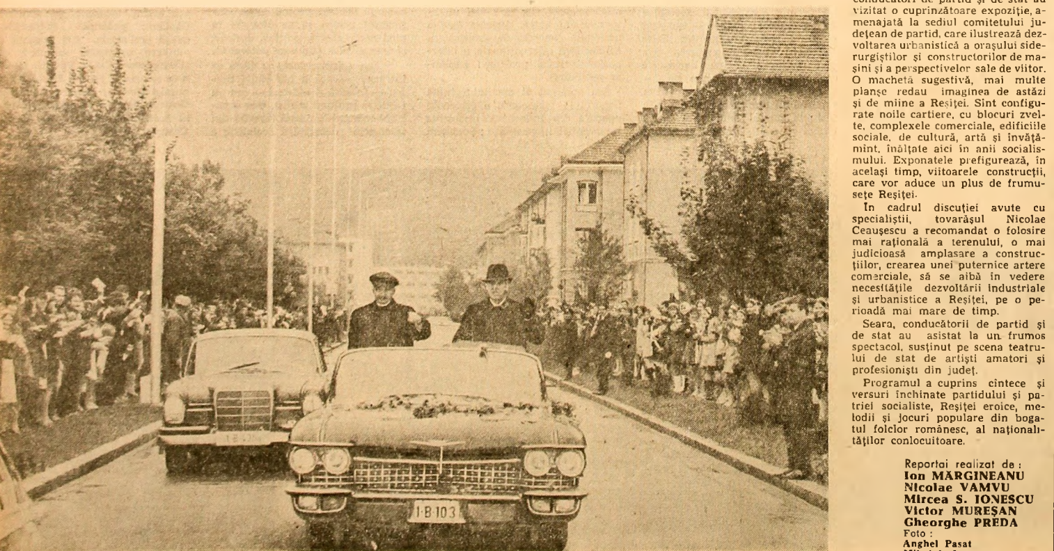
Pe străzile Reșiței, conducătorii partidului și statului sînt aclamați de mii de oameni