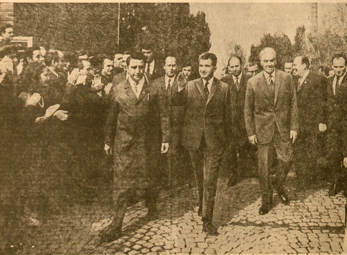
Muncitorii uzinei „23 August” întâmpina cu deosebită căldură pe înalții oaspeți

Se află aici mil de muncitori, ingineri, tehnicieni, lucrători în aparatură administrativă, toți muncitorii și funcționarii uzinei, invitați din alte unități industriale bucurestene, constructori de mașini. Pe macaralele portabile se văd drapelul roșii și tricolorul „uzinei” care slăvesc partidul, patria noastră — Republica Socialistă Română, un mare portret al tovarășului Nicolae Ceaușescu. Pe mari panouri se poate citi: „Ceaușescu-P.C.R.”, „Ceaușescu și poporul”, lozinci reînnoite cu dragoste de toți cei prezenți.