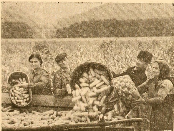
Recoltatul porumbului la cooperativa agricolă „Nicolae Bălcescu”, județul Vileca

Studenții din anii I-IV ai Institutului Agronomic „Nicolae Bălcescu” din București vor lucra efectiv timp de o lună de zile în unități agricole de stat. Un prim eșalon de aproape 500 de studenți din anul I se află deja la I.A.S. Odobești. Ieri, alți aproximativ 2.500 de studenți din anii II-IV, de la facultățile de horticultură, agronomie, economie agrară, zootehnie și veterinară, au pornit spre întreprinderile agricole de stat Valea Călugărească, Ostrov, Medgidia, Fetuți, Cîndești și Odobești, pentru a participa la stringerea recoltei de struguri, legume și fructe din unitățile respective.