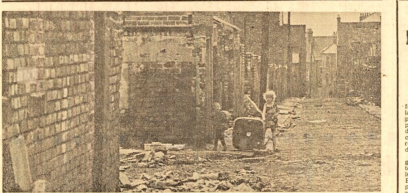
Rovagiile unui cutremur? Nu! O imagine obișnuită astăzi, pe o stradă din Newcastle - case în care cei săraci găsesc iluzia unui adăpost