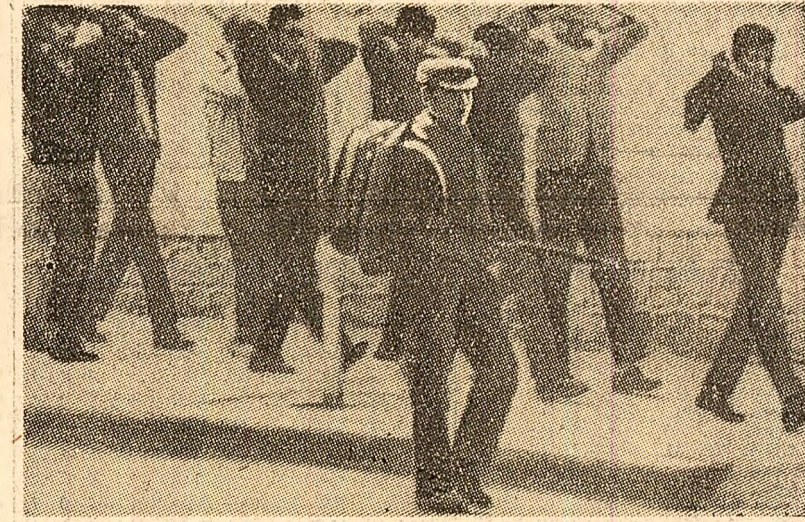
Bolivia : studenții ai Universității din La Paz arestați de forțele armate în urma recentelor acte de rezistență față de noile autorități.

Pe de altă parte, France Presse informează că la Madrid cîteva mii de muncitori continuă acțiunile greviste în semn de solidaritate cu cei 75 de lucrători concediați de Direcția Întreprinderii „Industrias Metalicas de Navarra S. A.”.