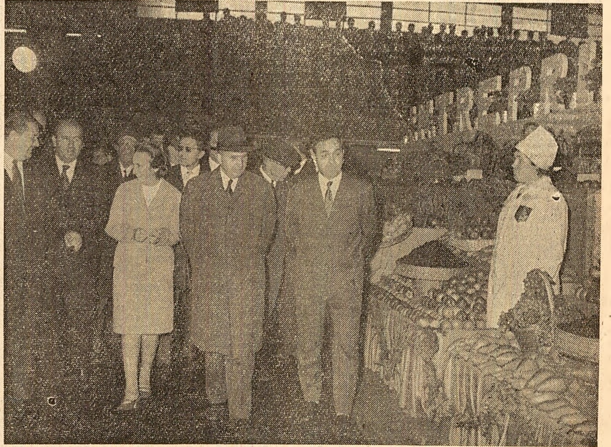
Se vizitează standurile din Halele Obor

Pe meleagurile județului Harghita a fost aceeași atmosferă de sărbătoare. Pînă mai ani trecuți cu potențial agricol slab valorificat, județul dispune azi de o agricultură de stat și cooperatistă mecanizată, în plină dezvoltare. Numai în actualul cincinal pentru lărgirea bazei tehnice a agriculturii, statul investise peste 300 milioane lei.