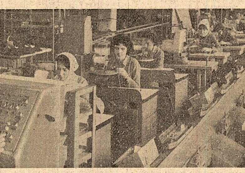
Intr-una din secțiile fabricii de pielărie și încălțăminte „Clujeana”