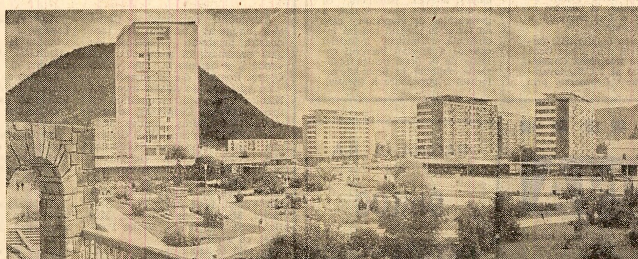
Vedere din Piatra Neamț