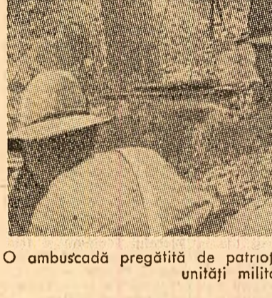
O ambuscadă pregătită de patrioții din Guinea Bissau împotriva unei unități militare portugheze

Agencia de presă eliberarea informează că, în ultimele săptămîni, forțele patriotice și populația provincială Quang Ngai, Binh Dinh, Phu Yen și Khanh Hoa au scos din luptă peste 570 militari saigonezi și americani. Ei au distrus 15 vehicule militare, au doborât patru avioane, au scufundat o ambarcațiune militară, și au capturat o mare cantitate de arme și muniții.