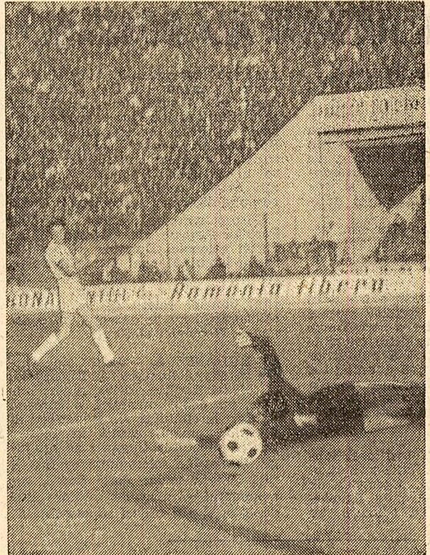
Răducanu a trebuit să se resemneze... (Golul lui Năstase, din meciul Steaua-Rapid)