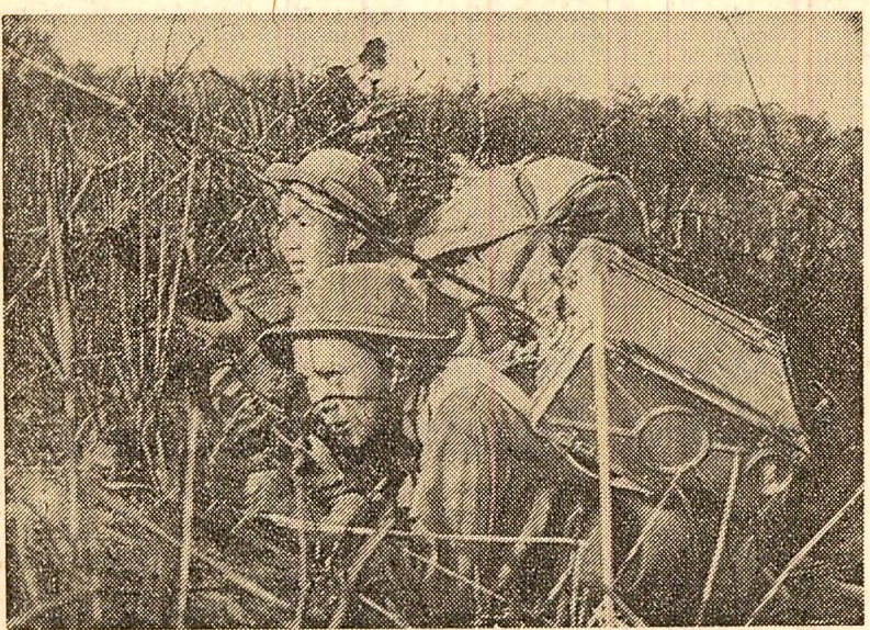
Patrioți sud-vietnamezi, într-o misiune de luptă, împotriva trupelor americano-sovietice