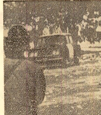
Tineret studios din Coreea de sud își intensifică lupta pentru lichidarea, împotriva terorii sălbatice a regimului dicatorial al lui Pak Cijon Hi. În ultima vreme, la Seul și în alte localități sud-coreene, manifestațiile studențești cunosc o amploare deosebită. În fotografie: Poliția este gata să reprime cu brutalitate o demonstrație a studenților din Seul