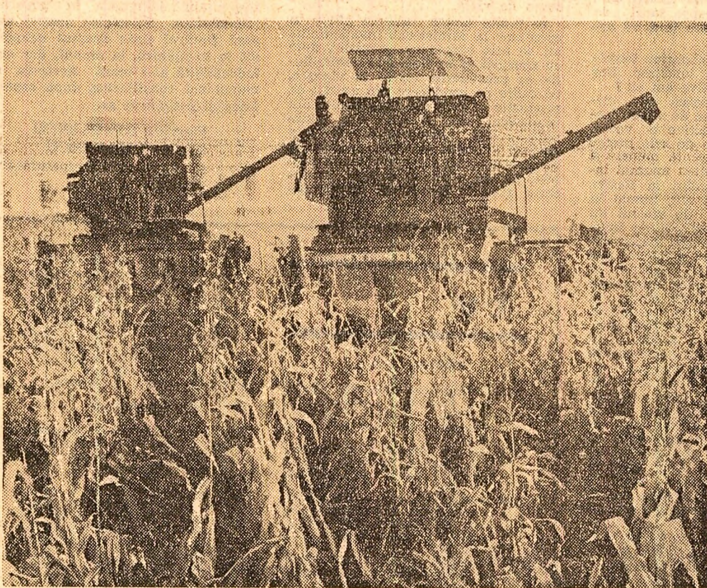
Recoltatul porumbului la cooperativa agricolă Măgura, județul Teleorman

Însămînțirea legumelor-verdețuri se însoțește printre lucrările agricole de maximă urgență în această perioadă. Se știe că, din grădiniile de legume, primele produse care ies pe piață primăvara sînt spanacul, salata, ceapa, usturoiul verde. Aceste produse au o deosebită importanță pentru aprovizionarea zilnică a populației într-o perioadă cînd nu se găsesc alte legume în cîmp. Suprafața care trebuie să se însămînțeze cu verdețuri este de 8.207 ha în cooperativele agricole și 696 ha în I.A.S. Deși suprafața este mică, aceasta nu trebuie să constituie un motiv pentru unitățile agricole de a amîna lucrările. Este foarte important ca prevederile să se realizeze în totalitate și într-un timp foarte scurt. Din datele centralizate la minister rezultă că, pînă la data de 22 octombrie, a. c., în cooperativele agricole s-au însămînțit 4.139 ha cu legume-verdețuri, iar în I.A.S. — 547 ha. Datorită pregătirii din timp a terenurilor, atenției acordate de specialiștii efectuării acestor lucrări, în cooperativele agricole din județul Buzău s-a însămînțit întreaga suprafață stabilită, iar în județul Vrancea s-a realizat 95 la sută din prevederi.