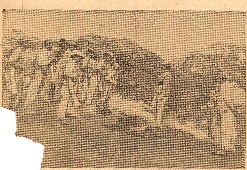
Aste facuți agenției algeriene de presă, Marcelino Dos Santos, seful Frontului de Eliberare din Mozambic (FRELIMO) a arătat că publicanți controlați în prezent întreaga regiune Cabora Bassa, în locul unde coloniștii portughezi construiseră un oraș, care ar urma să întîrsească dominația lor economică și politică. În fotografie: Un detașament al FRELIMO pregătindu-se pentru o acțiune împotriva coloniștilor portughezi

miko, ministrul afacerilor externe, Nikolai Patolichev, ministrul comerțului exterior. În aceeași zi, la Palatul Elysée a avut loc o primă convorbire între Georges Pompidou și Leonid Brejnev. Seara, în cinstea oaspetelui sovietic a fost oferit un dincoi, la care președintele Republicii Franceze și secretarul general al C.C. al P.C.U.S. au rostit toasturi.