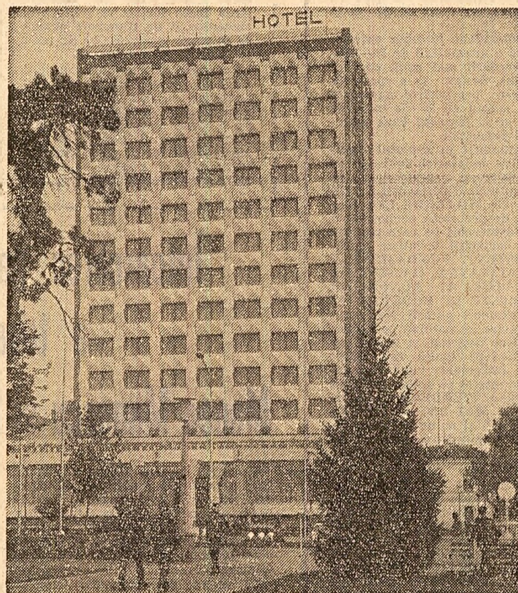
Noul hotel din orașul Braïlo

A mai pus la murat și alte adrese prin care locatarii se vată că nu au cîldură din cauză că blocul nu are tencușia exterioră. Au mai pus la murat alte plîngerii prin care se face