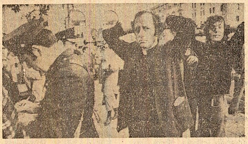
O nouă demonstrație de protest împotriva războiului din Vietnam a avut loc în capitala S.U.A. Policia a intervenit arestând peste 250 de persoane

ALGER — Președintele Algeriei, Houari Boumediene, a adresat premierului Ciu En-lai un mesaj în care, exprimându-și satisfacția față de restabilirea drepturilor legitime ale R. P. Chineze la O. N. U., apreciază că acest eveniment istoric, care constituie o victorie a tuturor oamenilor progresivi, va contribui la îmbunătățirea climatului internațional. „Sim-