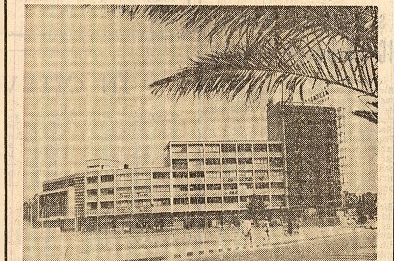
Astăzi, poporul etopian celebrează 41 de ani de la înconstruirea împăratului Haile Selassie I — sărbătoare națională a Etiopiei. Cu o existență și cultură milenară, „Tara Nihilului Albastru” și-a înscris în filele istoriei sale pagini de cutanță și eroism, fiind singurul stat cu o existență neîntreruptă de pe încercatul continent african. Istoria contemporană a găsit poporul etopian puternic angajat pe calea consolidării independenței economice și politice. Rafinării, centrale electrice, uzine și fabrici pentru punerea în valoare a resurselor proprii sint realități cu o pondere tot mai ridicată într-o economie în care producția agricolă ocupă locul principal. Pe plan extern, Etiopia se pronunță pentru relații cu toate statele, pentru lichidarea colonialismului și rasismului. Intre România și Etiopia s-au stabilit și se dezvoltă legături de prietenie și colaborare, în interesul ambelor țări și popoare, al cauzei păcii și progresului în lume. În fotografie: Vedere din Addis Abeba.

Cu o existență și cultură milenară, „Tara Nihilului Albastru” și-a înscris în filele istoriei sale pagini de cutanță și eroism, fiind singurul stat cu o existență neîntreruptă de pe încercatul continent african. Istoria contemporană a găsit poporul etopian puternic angajat pe calea consolidării independenței economice și politice. Rafinării, centrale electrice, uzine și fabrici pentru punerea în valoare a resurselor proprii sint realități cu o pondere tot mai ridicată într-o economie în care producția agricolă ocupă locul principal. Pe plan extern, Etiopia se pronunță pentru relații cu toate statele, pentru lichidarea colonialismului și rasismului. Intre România și Etiopia s-au stabilit și se dezvoltă legături de prietenie și colaborare, în interesul ambelor țări și popoare, al cauzei păcii și progresului în lume.