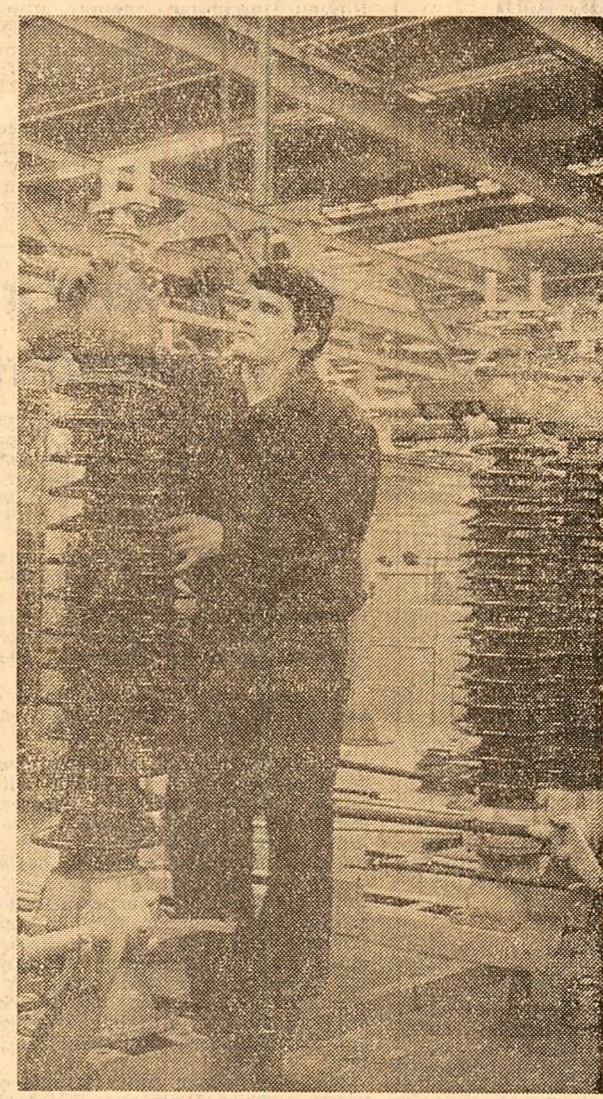
LA „ELECTROPUTERE” CRAIOVA

Este știut că în procesul de contractare este deosebit de important să se asigure de pe acum în contracte toate condițiile pe care le implică desigur, încheierea cu succes a contractelor, ca o activitate de asigurare a proceselor de producție. Și în această chestiune sint de semnalați unele neajunsuri. O serie de furnizori n-au părăsit obiceiul de a stabili în contracte, ca termene de livrare, ultima zi din trimestru. În aceste condiții, de ce posibilități dispun beneficiarii Fabricii de cabluri și materiale electrotehnice din București, al Combinatului siderurgic din Galați, al întreprinderii