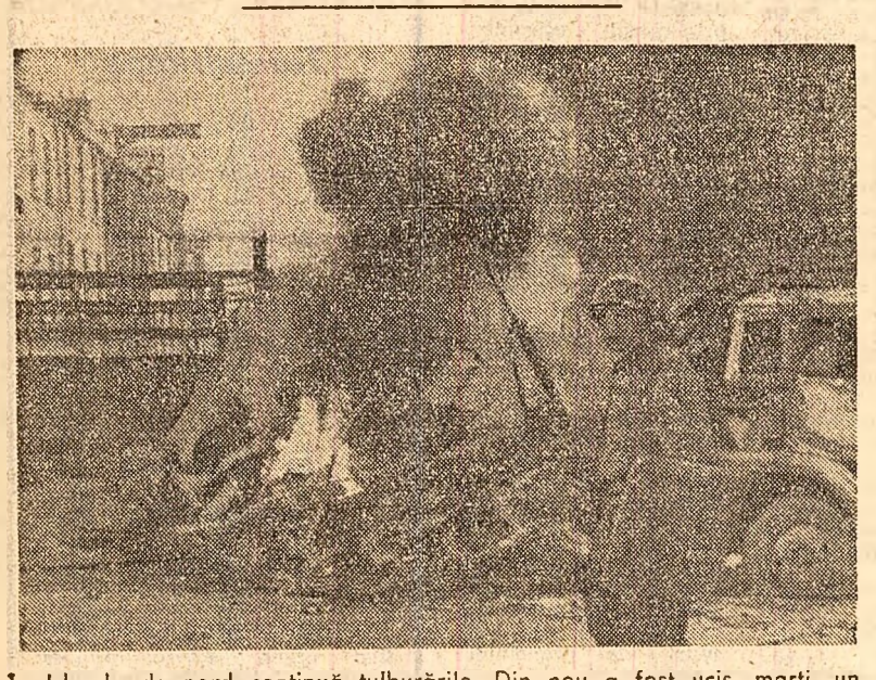
În Irlanda de nord continuă tulburările. Din nou a fost ucis, marți, un soldat britanic, numărul persoanelor care și-au pierdut viața în cursul acestui an în ciocnirile din Ulster ridicîndu-se la 123. În fotografie: După recentele incidente petrecute în localitatea Newry.