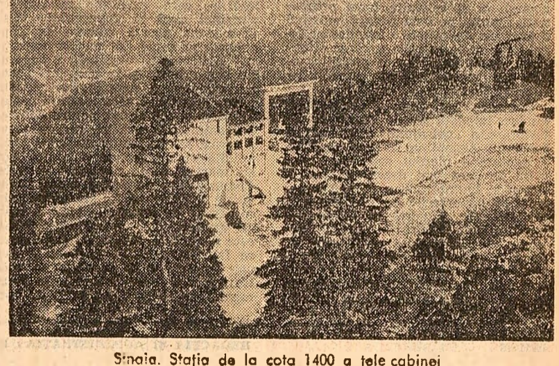
Sinea. Stația de la cota 1400 a telecabinei

de la Steaua au terminat învingători cu scorul de 2-1 (1-0, 0-0, 1-1). Într-un alt joc, echipa Agronomia Cluj a dispus cu 8-4 de formația Avîntul Miercurea Ciuc.