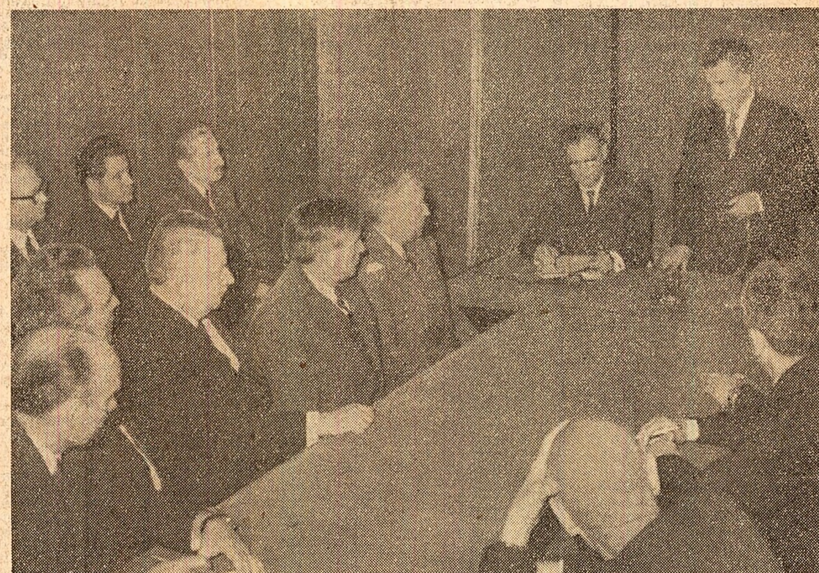
studenții au în centrul preocupărilor lor înfăptuirea neabătută a sarcinilor ce le revin pentru trunchierea în viață a programului de învățăminte inițiat de tovarășul Nicolae Ceaușescu, pentru îmbunătățirea continuă a muncii politico-ideologice și cultural-educative, pentru așezarea relațiilor din societatea