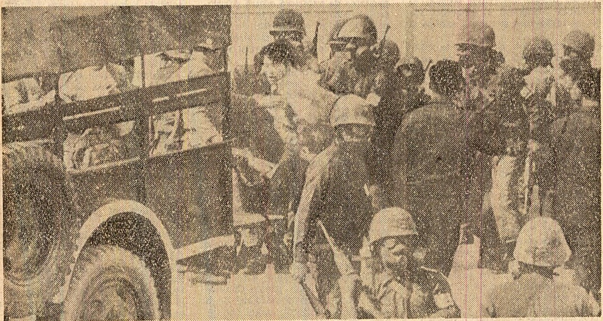
SEUL. Polția sud-coreeană intervine împotriva studenților participanți la una din recentele demonstrații anti-guvernamentale

Guvernul R.P.D. Coreean — arată agenția A.C.T.C. — depune toate eforturile posibile pentru a reduce tensiunea dintre Nord și Sud și pentru a se ajunge la reunificarea pasnică, fără amestec din afară, a patriei. Regimul lui Pak Cijun Hi și imperșalștii americani, declară în incheierea A.C.T.C., trebuie să pună imediat capăt eforturilor lor războinice, să retragă trupele agresoare imperialiste americane, sursă a pericolului constant de război în Coreea, și să pună capăt obstacolelor ridicate în calea luptei poporului coreean pentru reunificarea patriei.