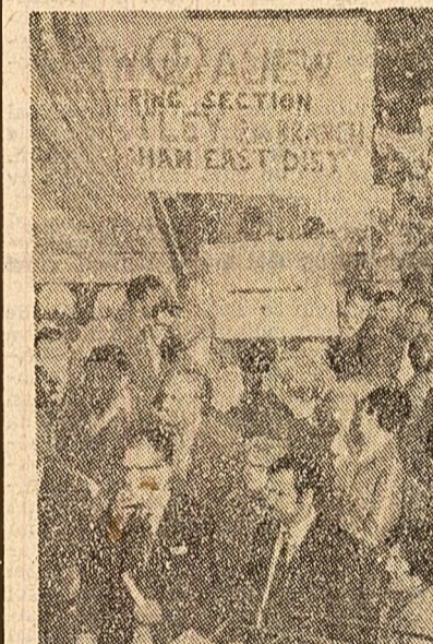
O demonstrație a muncitorilor la Birmingham împotriva concedierii a 3000 de angajați de la fabrica „Small Heath”

Pentru realizarea acestor obiective, ca și pentru terminarea celor aflate în curs de construcție, Repu-