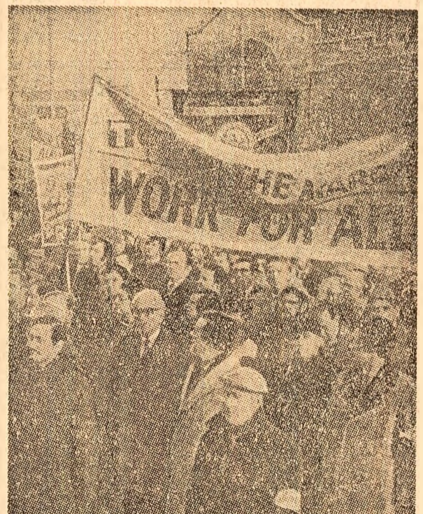
O puternică demonstrație împotriva creșterii șomajului a avut loc la Londra în fața Parlamentului britanic

Un alt conflict social de amploare s-a declarat, luni, în Italia, prin declanșarea unei greve de 48 de ore, de către cei peste 17 milioane muncitorilor agricoli, în semn de protest față de refuzul patronatului de a satisface revendicările prezentate de sindicatele din agricultură. Greviștilor li s-au alăturat, de asemenea, și aproximativ 200.000 de angajați ai întreprinderilor și instituțiilor de stat din agricultură.