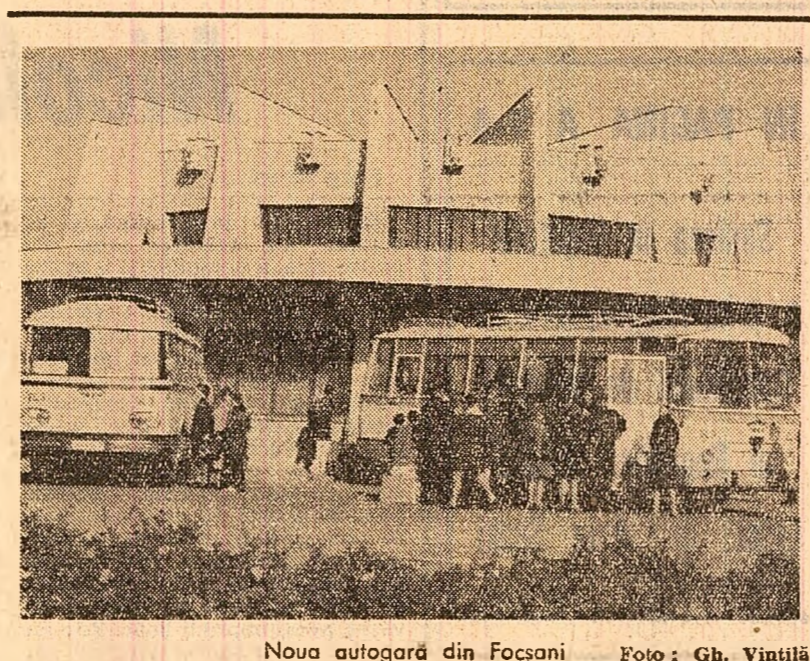
Noua autogară din Foșconi

— Totă vara m-am plimbat de la o comună la alta și-a arătat al nemulțumire. Nu avem ce ne trebuie. Cînd era timpul mai bun de muncă, am intrat pe la șantier, dar pe șantier îl găsim doar pe zidarul Vasile Sirbu, singurul reprezentant al IJECOOOP, constructorul magazinului.