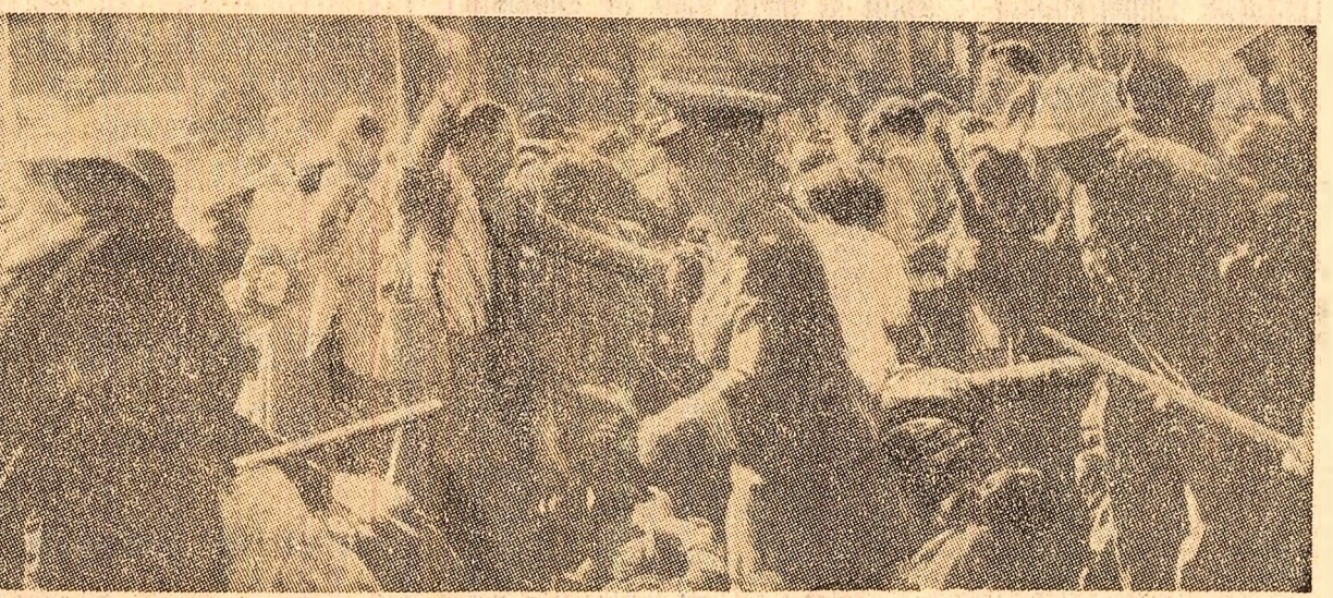
Jonahesburg. O imagine devenită cotidiană în Africa de Sud. Poliția împiedică cu brutalitate pe participanții la o manifestație împotriva opresiunii, discriminării și violenței

Agencia T.A.S.S. anunță că la Moscova au luat sfîrșit convorbirile dintre o delegație sovietică, condusă de acad. Boris Petrov, președintele Consiliului „Intercomos” de pe lângă Academia de Științe a U.R.S.S., și o delegație americană, condusă de doctor Robert Gilruth, directorul Centrului pentru zborurile cosmice pilotate al N.A.S.A., cu privire la probleme legate de crearea unor mijloace comune de apropiere și cuplare a navelor cosmice pilotate. Este cea de-a treia întîlnire dintre oamenii de știință americani și sovietici care lucrează în acest domeniu, menționîndu-se și faptul că cele două părți și-au exprimat satisfacția pentru rezultatele încununete de succes ale acestei întîlniri.