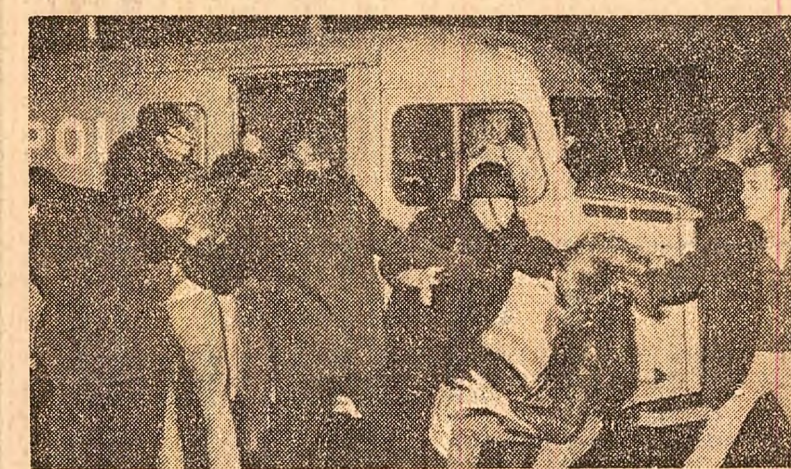
Demonstrație la Copenhaga împotriva nivelului ridicat al chiriilor. În fotografie: ciocniri între manifestații și poliție