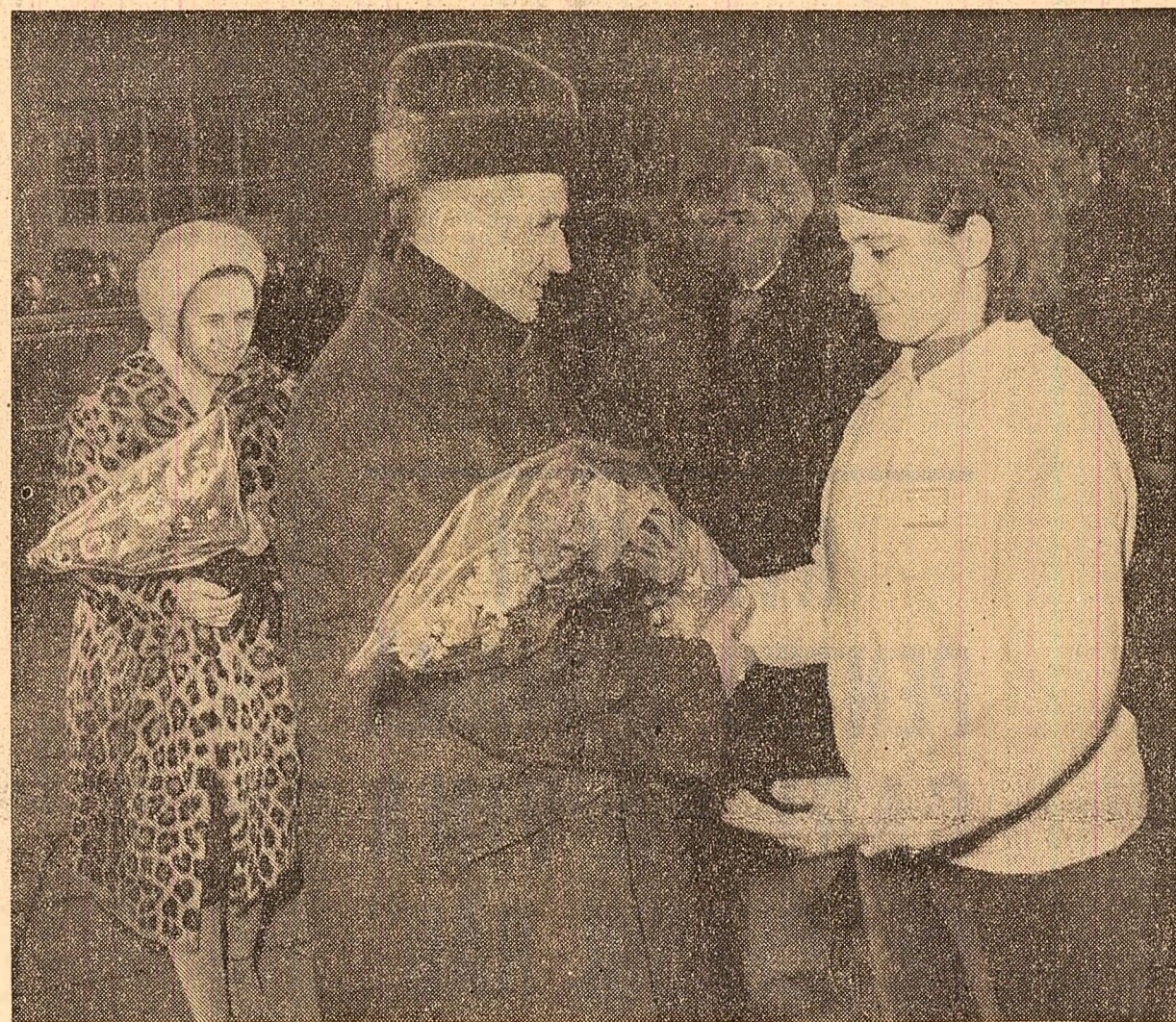
Flori pentru conducătorul iubit al partidului și statului nostru

dețele țării, secretarul general a purtat și acum un dialog viu cu muncitorii, inginerii și tehnicienii, ajutînd și mobilizînd la conturarea mai exactă a obiectivelor de plan, la direcționarea eforturilor colectivelor de muncă, proiectare, concepție în găsirea celor mai eficiente căi de realizare a sarcinilor de producție, de ridicare continuă a calității produselor, a productivității muncii, de reducere a prețului de cost. Obiectivele înscrise în programul vizitei de ieri, în marele centru industrial Brașov, le-au constituit uzinele „Tractorul” și „Rulmentul”. În vizita întreprinsă, tovarășul Nicolae Ceaușescu a fost însoțit de tovarășa Elena Ceaușescu, de tovarășii Maxim Berghianu, membru al Comitetului Executiv al C.C. al P.C.R., președintele Comitetului de Stat al Planificării, și Constantin Drăgan, membru al Comitetului Executiv al C.C. al P.C.R., prim-secretar al Comitetului județean Brașov al P.C.R.