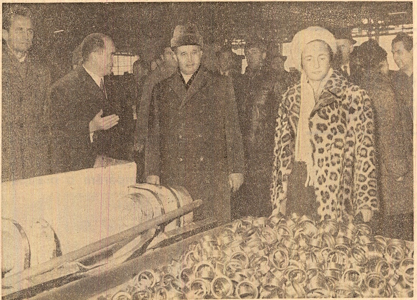
Se vizitează una din secțiile întreprinderii unde se fabrică „bijuterii” de oțel