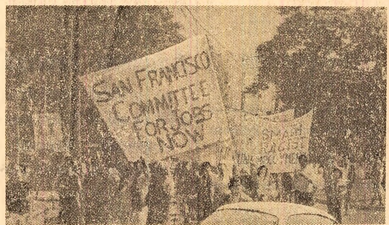
La Sacramento, în statul California, a avut loc recent o puternică demonstrație împotriva creșterii somajului. În fotografie: aspect din timpul manifestăției în care participanții cer crearea de noi locuri de muncă.

VIETNAMUL DE SUD 10 (Agerpres). — În cursul anului 1971, forțele patriotice din Vietnamul de sud care acționază în zona „Platourilor înalte” au scos din luptă 18.100 militari din rîndul trupelor americano-saigo-neze. Informează agenția de presă Elibersrea. În același an, deplasamentele patriotice din regiunea amintită au distrus 137 avioane, aproximativ 400 blindate și au incendiat 27 de depozite militare.