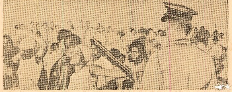
În pol. da represiuilor polițienești, populația de culoare din Rhodesia continuă lupta împotriva poliției de discriminare rasială, pentru condiții omonești de viață. În fotografie: aspect din timpul unei mari demonstrații la Salisbury.

BEIRUT 10 (Agerpres). — La Beirut s-au încheiat lucrările celui de-al III-lea Congres al Partidului Comunist Libanez. Congresul a adoptat o serie de documente politice în problemele examinabile, între care rezoluția pe marginea raportului de activitate a C.C. al P. C. Libanez, rezoluția cu privire la situația din Indochina, precum și o rezoluție în problema palestiniană. În ultima zi a lucrărilor, congresul a ales noile organe de conducere: secretar general al C.C. al P.C. Libanez a fost reales Nikola Saoui. La lucrările congresului au participat delegații ale unor partide comuniste și muncitorești; a luat parte o delegație a C.C. al P.C.R., formată din tovarășii Mihail Gure, membru supleant al Comitetului Executiv, secretar al C.C. al P.C.R., și Vasile Marin, membru al C.C. al P.C.R., prim-secretar al Comitetului județean Iași al P.C.R. Cuvîntul de încheiere a fost rostit de Nikola Saoui.