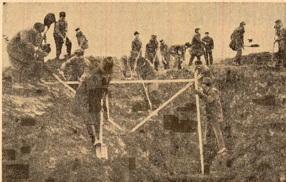
La cooperativa agricolă Bolentinu hirlului și draglina s-au unit pentru a deschide drum apelor în exces

Ca răspuns la chemarea Comitetului județean de partid Argeș, în toate județele se desfășoară ample lucrări de îmbunătățiri funciare. În aceste zile, când nu sînt alte lucrări de executat în câmp, cooperatorii, cedează locuitorii și comenelor au ieșit în număr mare pentru a da viață angajamentelor luate. Se execută canale noi și se decolmează cele vechi pentru evacuarea excesului de umiditate, se înalță diguri, se fac amenajări pentru irigații — totul pentru ca fiecare palmă de pământ să fie folosită cât mai bine.