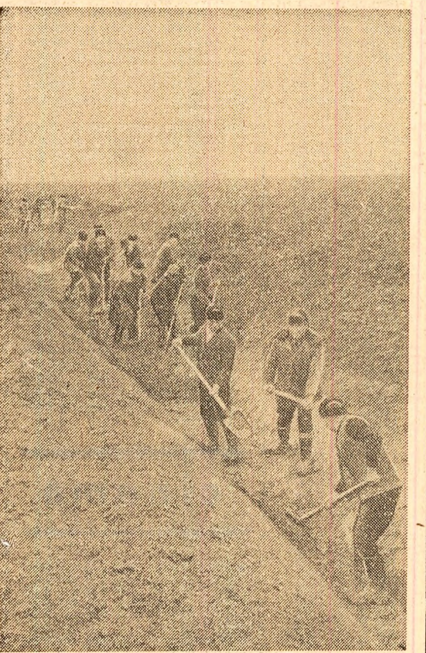
La cooperativa agricolă din Jirlău, județul Brăila, se lucrează intens la executarea canalelor pentru scurgerea excesului de apă.