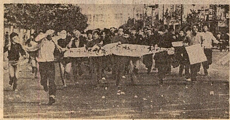
Manifestație la Seul împotriva legalizării stării excepționale de către clasa guvernamentală. Pe pancarta purtată de demonstrații scrie: „Să se sfârșească cu ilegalitățile și corupția săvârșite în numele națiunii”.

ilie la Santiago de Chile, se arată că monopolurile internaționale reprezintă „un pericol și nu un sprijin pentru economiile țărilor în curs de dezvoltare”. Raportul relevă că „există chiar state dezvoltate, cum sunt Australia, Canada și Franța, care manifestă o îngrijorare serioasă în legătură cu rolul jucat în viața lor economică de companii internaționale”.