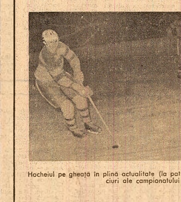
Hocheiul pe gheață în plină actualitate (la patinoarul acoperit „23 August”, meciuri ale campionatului național)

poarnescă, promișind că se va opri la primul milițian întîlnit. Perspectiva aceasta se vede că nu-l prabu conștientizat amator, căci imediat cum trece de un porțiu, n-a găsit o cale mai bună de răzuinare, decît să apuce funiile troleibuzului, să tragă brațele de contact de pe firele electrice făcîndu-le să se izbească în jberbe de scintile ale scurtcircuitului. Astăzi, conducătorul, care iar fi putut fi înmînat mîmă, a coborît din nou și, prinzîndu-l pe făptuș, a încercat să-l admonesteze. Dar „Zorro” sau, mai exact zis, huliganul, era pus pe gîlceavă, ojerind spectatorilor o demonstrație de lupte libere. Tocmai trecea însă pe-acolo un bărbat de vreo cincizeci de ani, cu un suferțas în mîină în care aburea mîncarea caldă. Văzînd scena, și-a pus domol suferțasușul lîngă un gard, și a lăsat o mîină grea pe umărul sinărului.