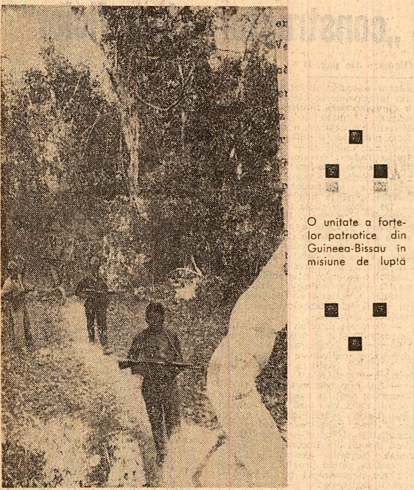
O unitate a forțelor patriotice din Guineea-Bissau în misiune de luptă

O bombă a explodat în locuința fostului ministru argentinian al justiției, Jaime Periaux. Explosia a făcut patru victime, iar alte șapte persoane au fost rănite.