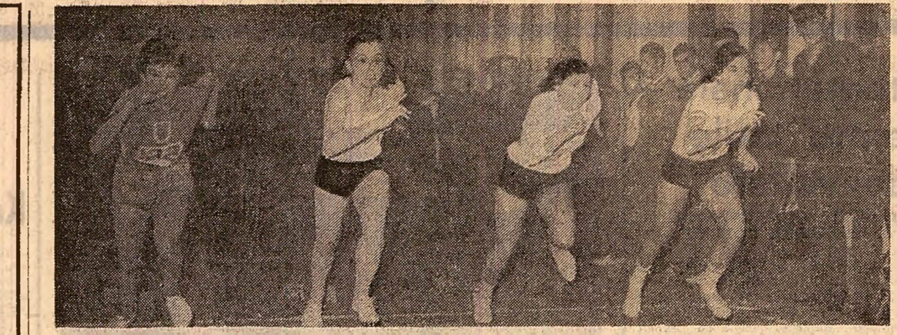
Sezonul athletic de solă l-au deschis juniorii (un start al sprinterilor, în solă „Viitorul”)