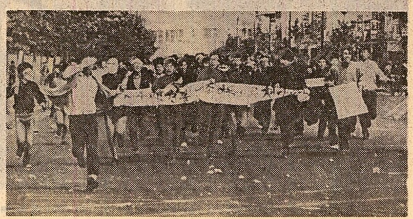
Manifestație la Seul împotriva legalizării stării excepționale de către clasa guvernamentală. Pe pancarta purtată de demonstrații scrie: „Să se sfârșească cu legalitățile și corupția săvârșite în numele națiunii”.

CAPE KENNEDY 16 (Agerpres). — Sonda spațială americană ce urmează a fi lansată la 27 februarie a.c. în direcția planetei Jupiter a fost transportată la turnul de lansare de la Cape Kennedy. În greutate de 246 kg, „Pioneer-F” este prima din sondelor americane care urmează să fie lansată spre planetele îndepărtate ale sistemului solar și să parșească chiar zona acțiunii forțelor