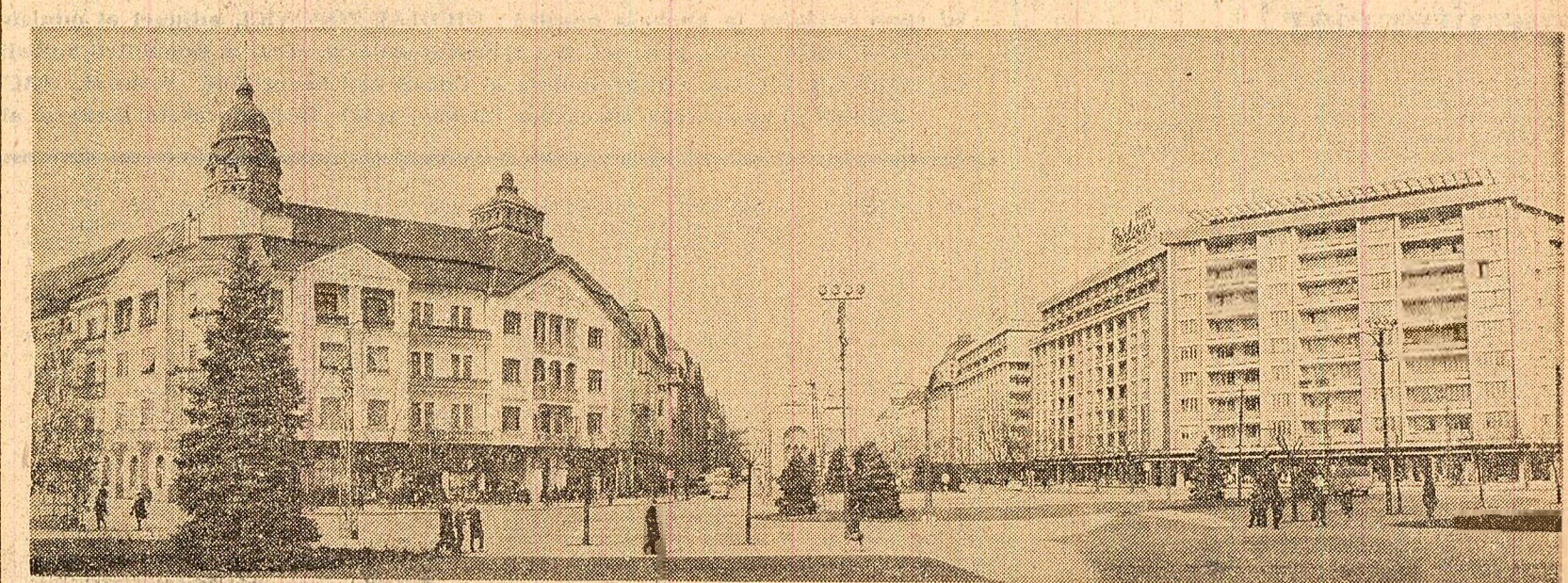
Centrul orașului Timișoara.