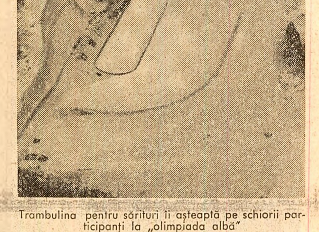
Trambulina pentru sărituri în așteaptă pe schiorii por-ticipanți la „olimpiada albă”

După cum se știe, peste numai patru zile la Sapporo va începe desfășurarea marilor competiții „Olim-piada albă” — la care par-ticipă aproape 1300 de spor-tivi din 35 de țări ale lumii, inclusiv din țările în de-voluție. La această „Olim-piada albă” — în care par-ticipă aproape 1300 de spor-tivi din 35 de țări ale lumii, inclusiv din țările în de-voluție. La această „Olim-piada albă” — în care par-ticipă aproape 1300 de spor-tivi din 35 de țări ale lumii, inclusiv din țările în de-voluție.