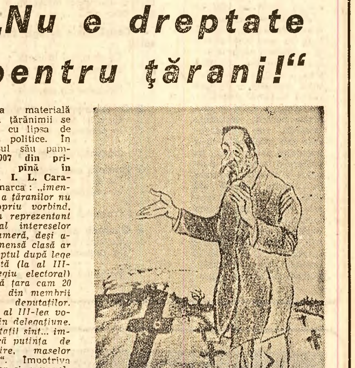
Le-am dat pământ! ISER (1907)