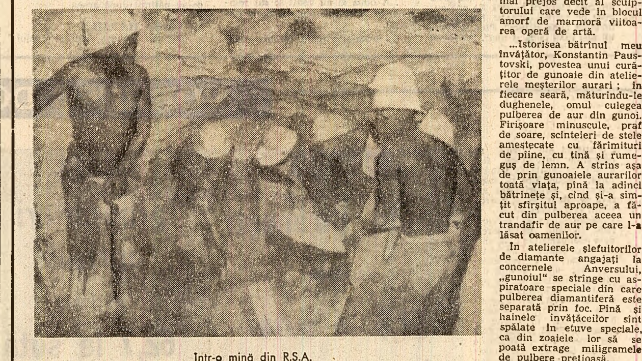
Într-o mină din R.S.A.

Graficele de mai sus — pe care le reproducem dintr-un număr recent al revistei „U.S. News and World Report” — infirmăzesc creșterea medie a costului existenței medicale în Statele Unite în ultimii cinci ani: