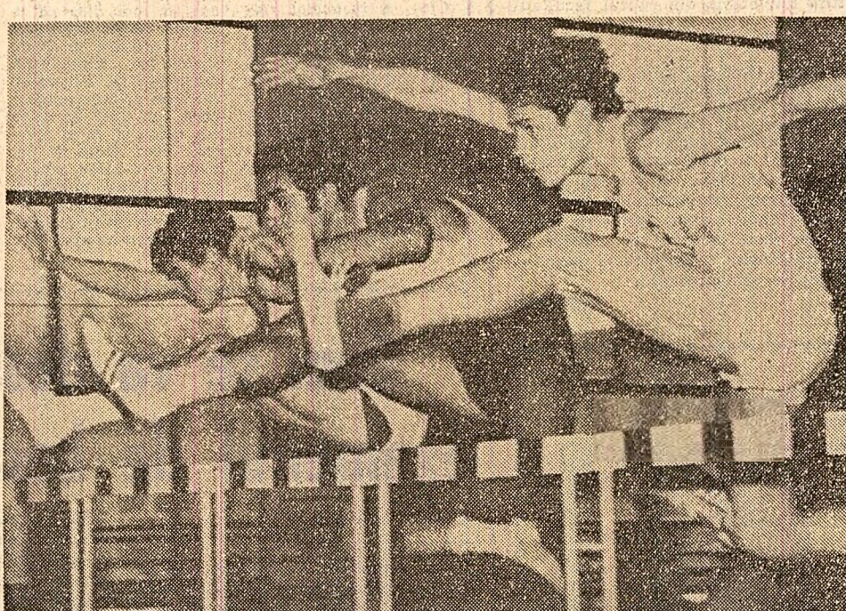
„Zbor peste garduri” (instantaneu la primul concurs athletic al anului pe pista de tartan a sălii „23 August” din Capitală)