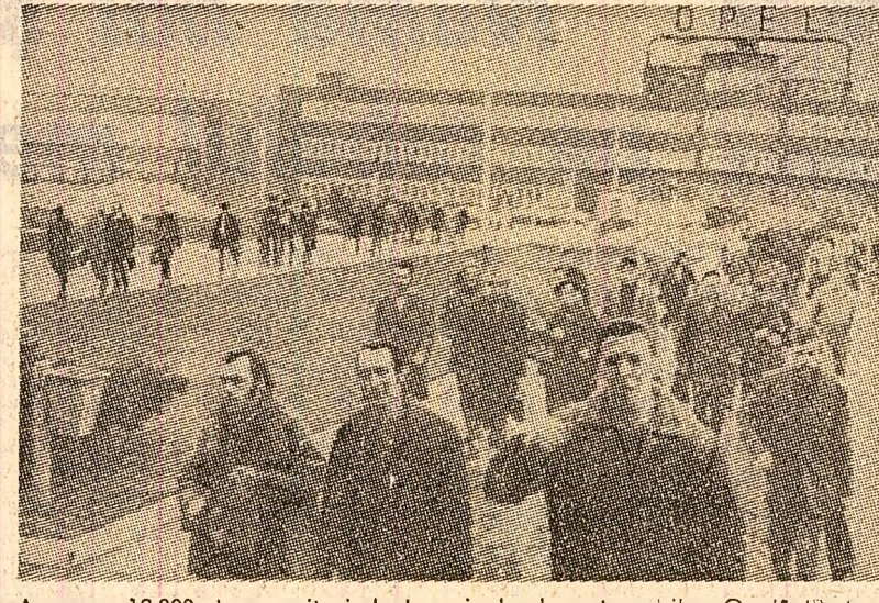
Aproape 19.000 de muncitori de la uzinele de automobile „Opel” (R. F. a Germaniei) s-au trezit pe neașteptate în concediu, forțat: din cauza dificultăților de desfacere, uzina din Bochum și-a închis porțile pe timp de patru zile