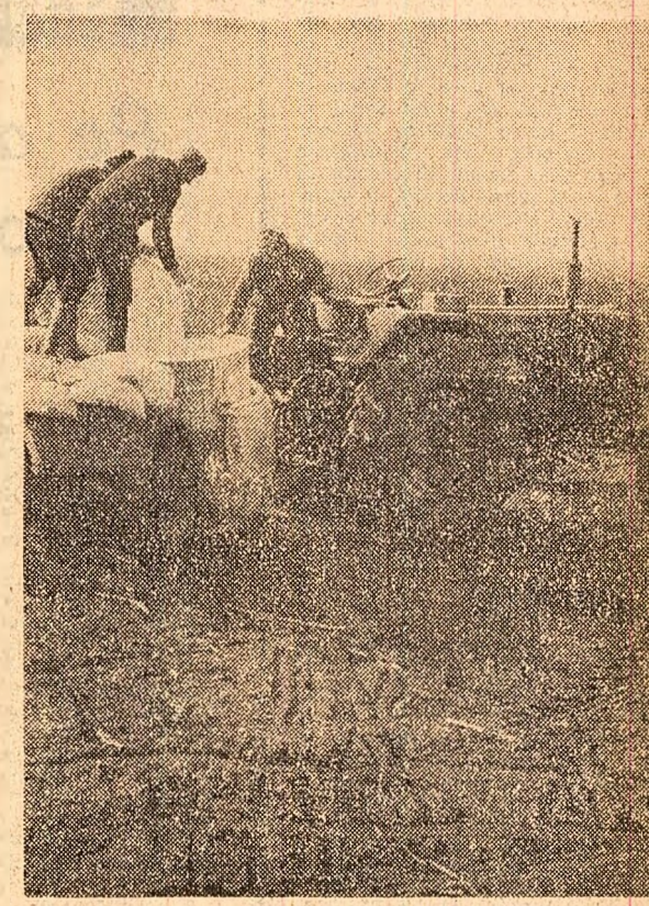
La C.A.P. Coșereni — în timpul lucrărilor de administrare a îngrășămintelor chimice

Excelentei Sale Domnul NICOLAE CEAUȘESCU Președintele Consiliului de Stat al Republicii Socialiste România BUCUREȘTI Vă rog să primiți, Domnule Președinte, sincere mulțumiri pentru amabilul mesaj de simpatie adresat de Dumneavoastră și de Consiliul de Stat al Republicii Socialiste România mie și familiei regale, cu ocazia morții iubitelui meu tată, Majestatea Sa Regele Frederik al IX-lea. Totodată, doresc să vă exprim sincere mulțumiri pentru bunele urări transmise cu prilejul urcării mele pe tron. Împărtășesc pe deplin dorința Dumneavoastră de dezvoltare în continuare a relațiilor bune și de prietenie dintre țările noastre. MARGRETHE A II-A Regina Danemarcei