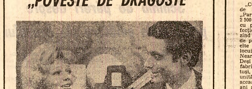
O producție a studiourilor din R. P. Ungară, un film de István Szabó.