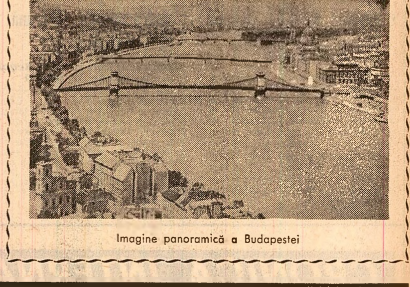
Imagine panoramică a Budapestei

Zilele trecute a avut loc o sesiune științifică la capitala ungară care a adoptat noi măsuri pentru dezvoltarea și înfrumusețarea orașului. După cum s-a anunțat, în acest an se vor construi peste 15.000 de noi apartamente și se vor înălța noi hoteluri, fabrici de produse alimentare, complexe comerciale, școli, creșe și cămine de copii. Imaginea în conștiința publică a Budapestei reflectă în mod elocvent, o dată cu tentele creatoare ale noi cartiere însumînd vîntoarea ascendență a intereselor sale patrii socialiste pe calea progresului și înfloririi.