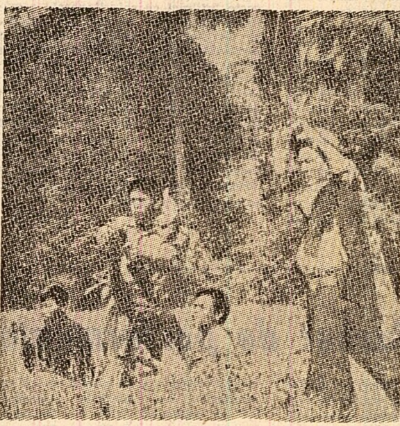
Cambodgia. O grup de patrioți se pregătesc să deschidă focul împotriva inamicului.

vietnameze, declarația subliniază că guvernul sovietic „susține pe deplin cererile juste ale poporului vietnamez și își reafirmă politica de sprijinire fermă a luptei popoarelor Vietnamului, Laosului și Cambodgiei împotriva agresiunii imperialiste, pentru reglementarea problemelor Indochinei în interesul popoarelor din această regiune”.