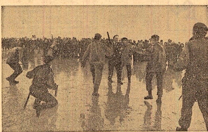
Irlanda de Nord. Cincintri trupele britanice și participanții la recenta demonstrație, de la Londonderry, împotriva interzicerii în lagăre a militanților pentru drepturi civile