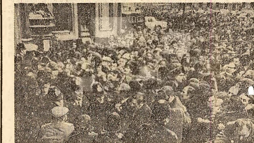
În fața parlamentului britanic a avut loc o puternică manifestație la care au participat mineri aflați în grevă și muncitori londonezi care s-au solidarizat cu aceștia. Demonstrații au cerut satisfacerea revendicărilor greviștilor

Dimpotriva, a spus Collins, după aplicarea tuturor impozitelor și taxelor și în contextul creșterii prețurilor la scară națională, veniturile nete ale minerilor sînt și mai scăzute decît înainte de declanșarea acțiunii revendicative. Consiliul Executiv al sindicatului minerilor din Kent — a adăugat liderul sindical — va protesta față de hotărîrea conducerii Uniunii naționale a minerilor, care a dispus inițierea pichetelor greviștilor din presăma depozitelor și minelor de cărbune înalte ca membrii organizațiilor sindicale din cadrul uniunii să se pronunțe, prin vot, asupra propunerilor avansate de guvern.