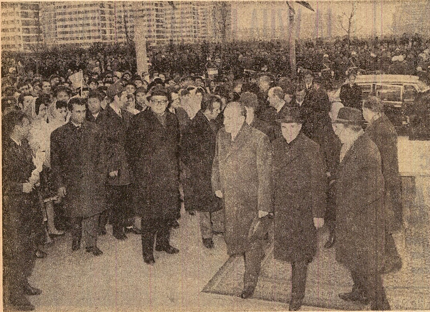
Printre locuitorii cartierului Titan