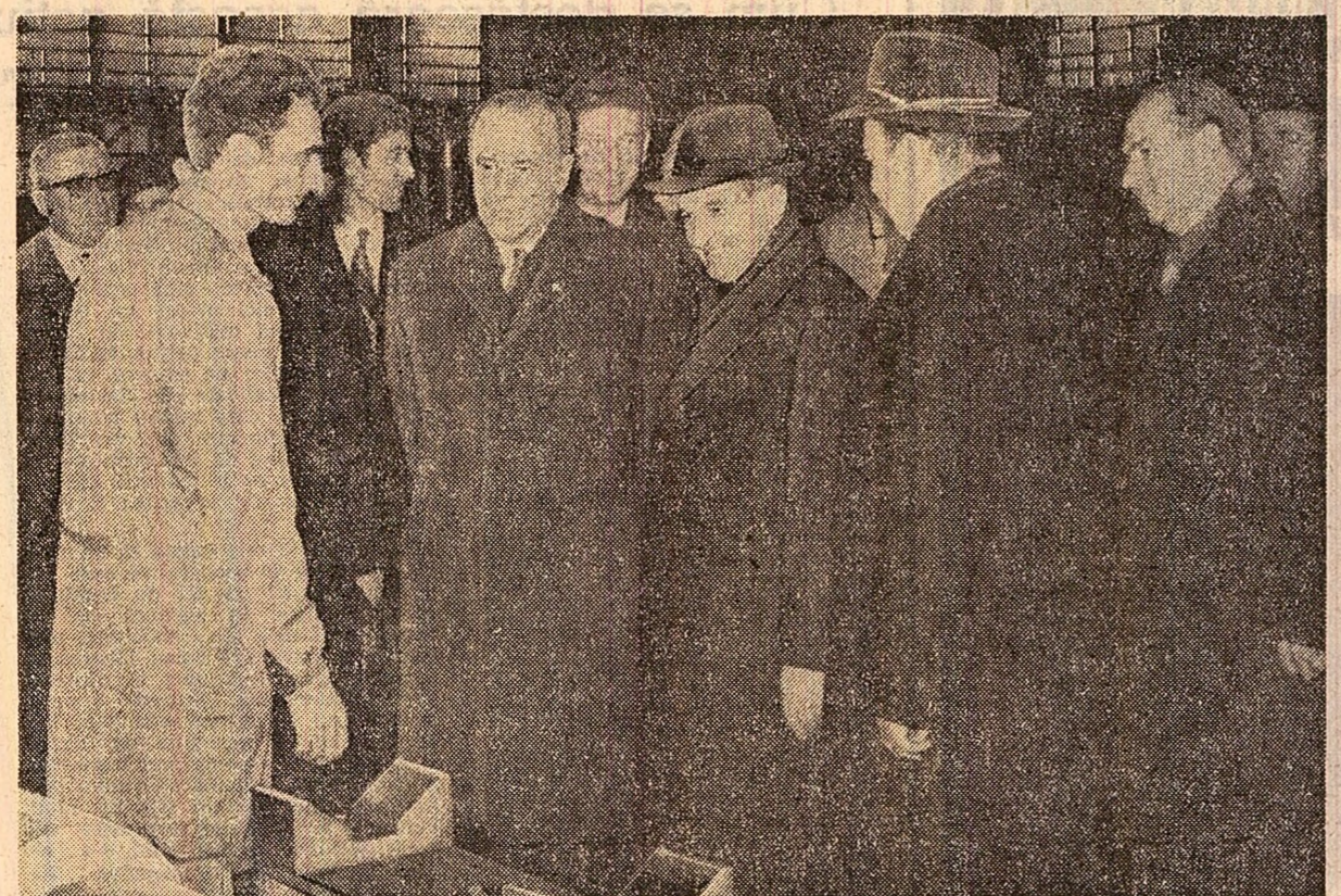
La Fabrica de mașini-unelte și agregate — București

Mitingul la sfîrșit într-o atmosferă sufletească, expresie vie a sentimentelor frățesci, de simțămîntă prețioasă care le nutrește reciproc popoarele români și ungari. (Agerpres)