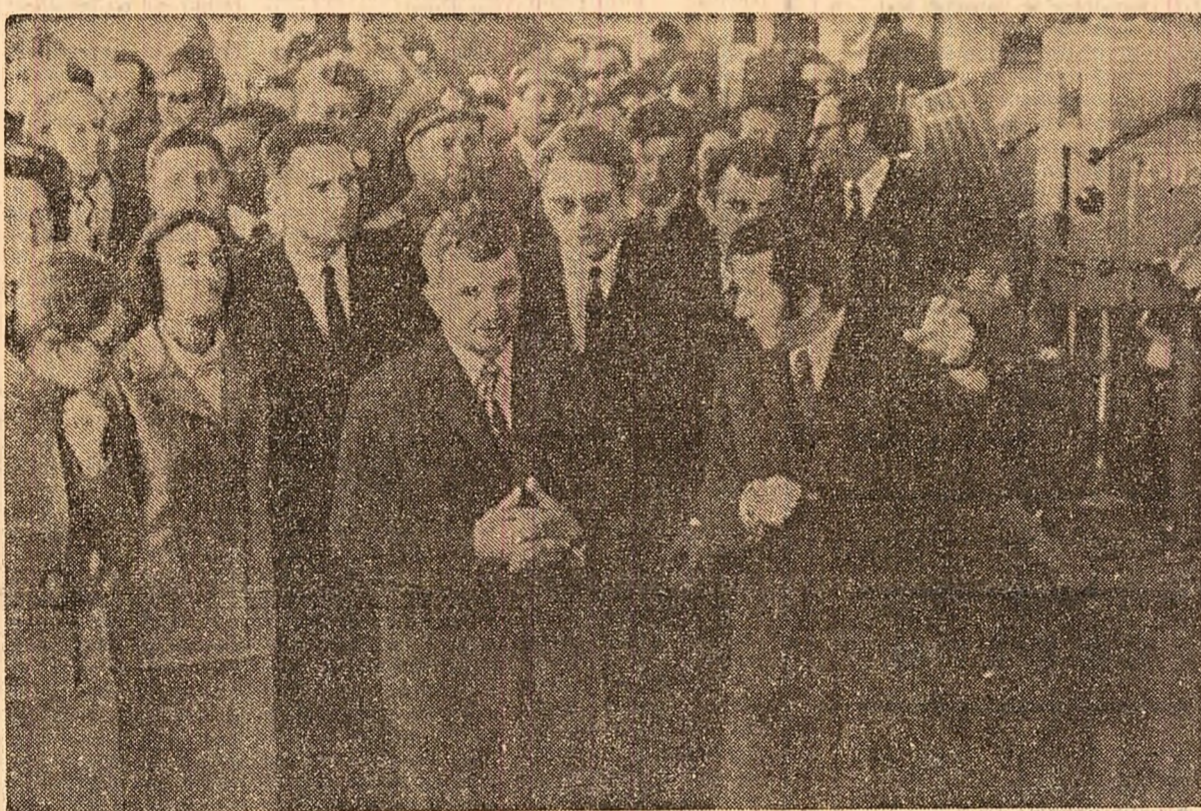
La uzina de tractoare „Sonacom”

Cortegiul oficial se îndreaptă apoi spre Constantine. Înșuruiți de o parte și de alta a șoselei, călăreții înarmați veniți din satele apropiate trag în aer salve de salut. Acest pitoresc obicei pe care localnici îl numesc „el furussa” marchează momentele sărbătorești prin care oamenii își exprimă sentimentele de bucurie cu prilejul marilor evenimente. Și azi, aici, ca și la Alger, sîntem martorii unei emoționante manifestări populare care reunește mii și mii de localnici. Răsună urale, aplauze, o ploaie de petale și confeti multicolore se revarsă din mulțime către oaspeți. Primarul municipalității, Abdelkrim Seredi, adresează tovarășului Nicolae Ceaușescu și tovarășii Elena Ceaușescu urări de bun venit, exprimînd sentimentele de grațitudine ale cetățenilor orașului Constantine pentru această vizită și înmînează, simbol al unei înalte prețurii, cheia de aur a orașului. Pantele colinelor ce mărginesc de-o parte și de alta șoseaua s-au transformat în adevărate amfiteatre vii, întregind imaginea Arcului de