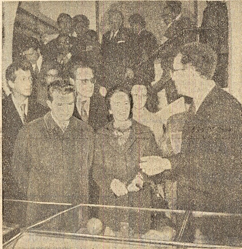
În fața unor mărturii istorice

În cursul serii de luni, televiziunea algeriană a consacrat un program de o jumătate de ora României, program filmat de trimisii săi speciali în țara noastră. În cadrul acestei emisiuni au fost prezentate pe larg preocupările actuale ale poporului român pentru edificarea societății socialiste multilaterale dezvoltate.