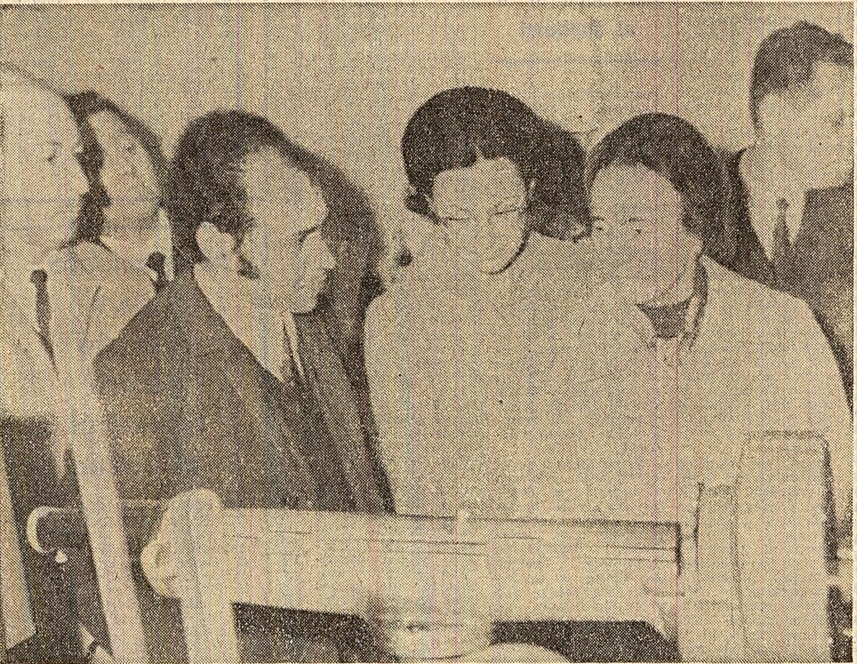
Tovarășa Elena Ceaușescu la Școala națională politehnică

Au fost vizitate apoi laboratoarele și atelierele școlii ale unor secții, printre care secțiile de mecanică, electrotehnică, chimică, precum și sectorul de informatică și program, dotat cu calculator.