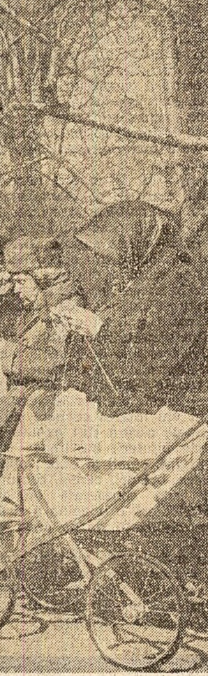
leri, în Cîșmigiu

Creșterea industriei noastre socialiste, fabrica de confecții din Bacău dispune de linii tehnologice moderne, instalate în spații minoase bine întretinute. De circa două decenii în atelierelor și secțiile de aici, oameni pasionați de meșeria lor realizează un bogat nomenclatur de produse. Muncind cu hîrnicie, colectivul unității a livrat de la începutul anului și pînă acum, peste sarcina de plan, confecții în valoare de aproape 3,5 milioane lei. Aplicarea unui ansamblu de măsuri tehnico-organizatorice a făcut ca producția să crească de la an la an. Dar cea mai importantă realizare care a adus fabricii bîcșuane un binecunoscut prestigiu a fost constituirea calitatea ireproșabilă a confecțiilor. De zile fabrica n-a mai primit nici o reclamație privind calitatea produselor. În fabrica de confecții din Bacău a devenit una din