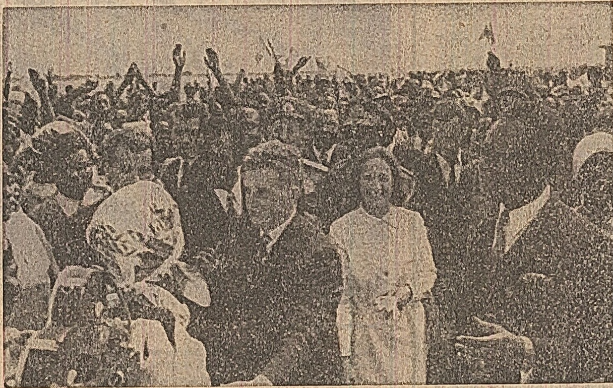
Urale şi ovajii pentru prietenia româno-zairiană

„Preşedintele român ne aduce un incurajator mesaj de cooperare şi pace“