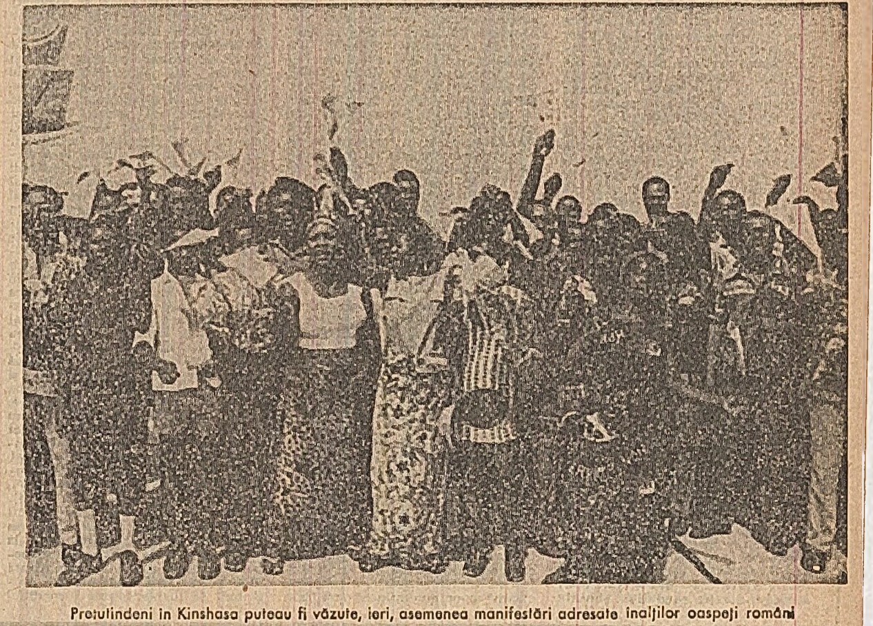
Prezidenţii în Kinshasa puteau fi văzuţi, ieri, asemenea manifestări adresate înalţilor oaspeţi români

Admirînd talentul artiştilor zairieni, tehnica specifică de redare a unor tematici inspirate din viaţa continentalului african, tovarăsa Elena Ceauşescu a mulţumit gazdelor pentru prilejul ce i s-a oferit de a cunoaşte aspecte ale vieţii artistice zairiene. În continuare, tovarăsa Elena Ceauşescu a vizitat un interesant centru de educaţie politehnică a tinerelor fete, aşezămînt care pregăteşte cadrele necesare activităţilor sociale şi economice ale ţării. În încheierea vizitei, tovarăsa Elena Ceauşescu a semnat în cartea de onoare a centrului de educaţie politehnică.