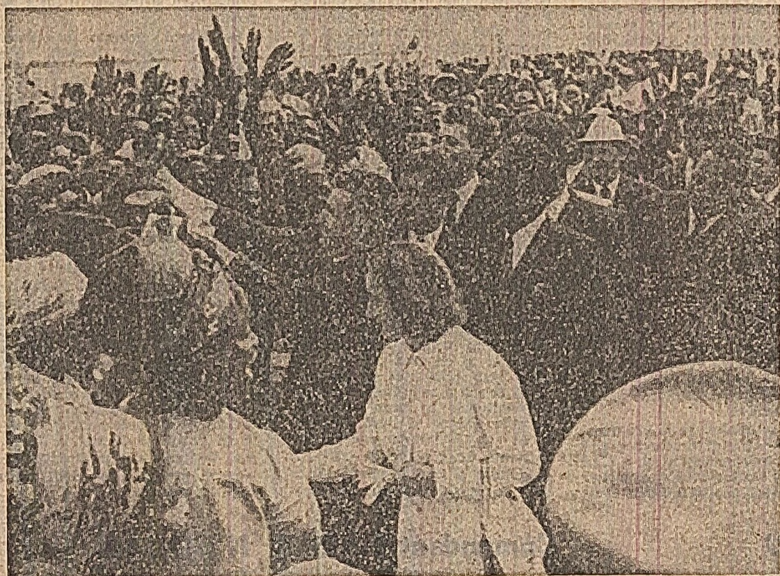
Ilustrație vie a sentimentelor de prietenie, a entuziasmului cu care a fost întâmpinat ieri, pe aeroportul din Kinshasa, președintele Consiliului de Stat al României.