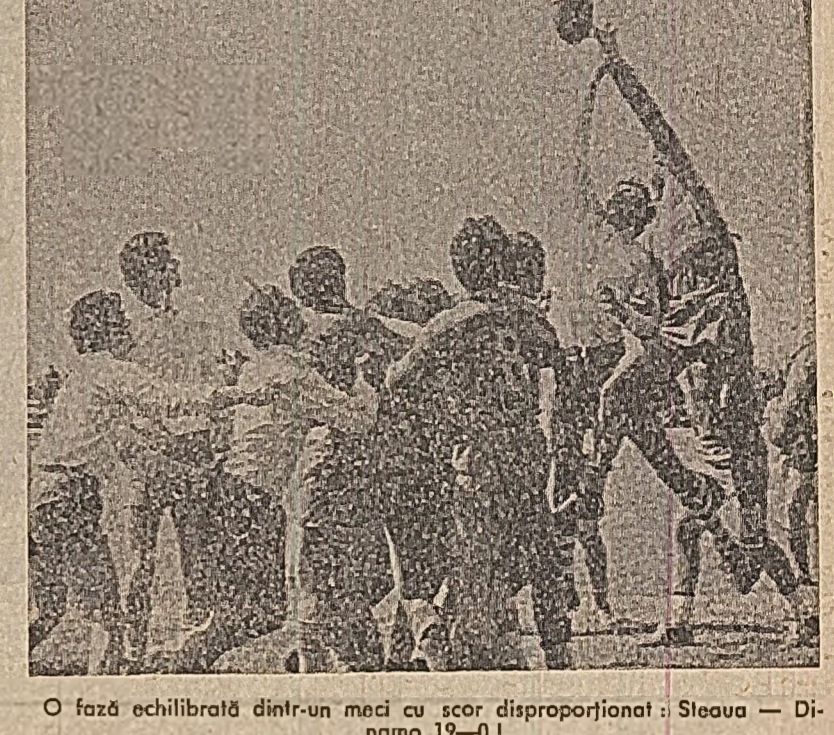
O fază echilibrată dintr-un meci cu scor disproporționar: Steaua — Dinamo 19—0