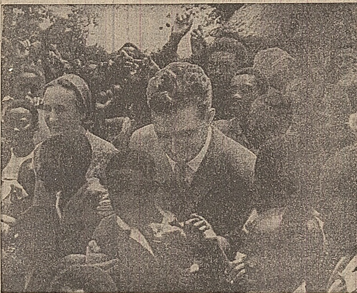
Ca preluțind în Zambia un nou popas în mijlocul populației, o nouă manifestare de caldă prietenie