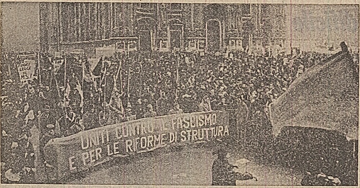
„Unii împotriva fascismului și pentru reforme structurale”. Sub această lozincă a avut loc recent, la Milano, o puternică demonstrație a muncitorilor italieni, hotărâți să dea o ripostă hotărâților uneltirii elementelor neofasciste