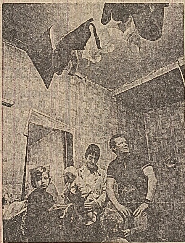
„Locuință” într-un subsol la Glasgow