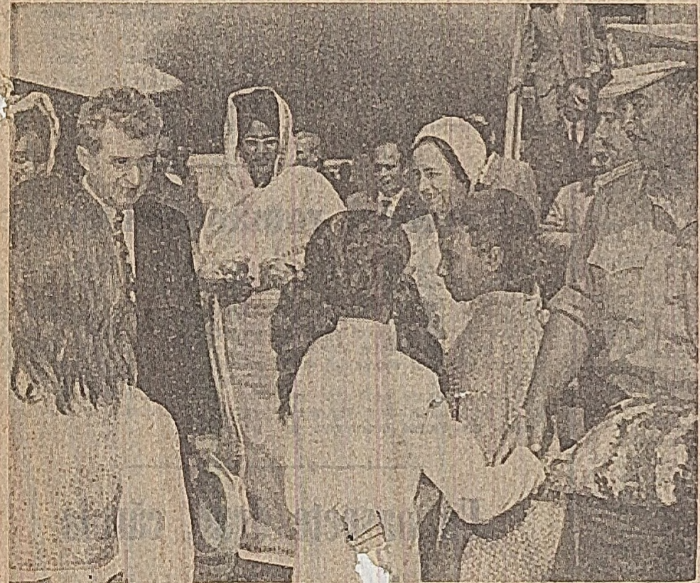
Primire caldă, prietenească pe aeroportul din Khartoum