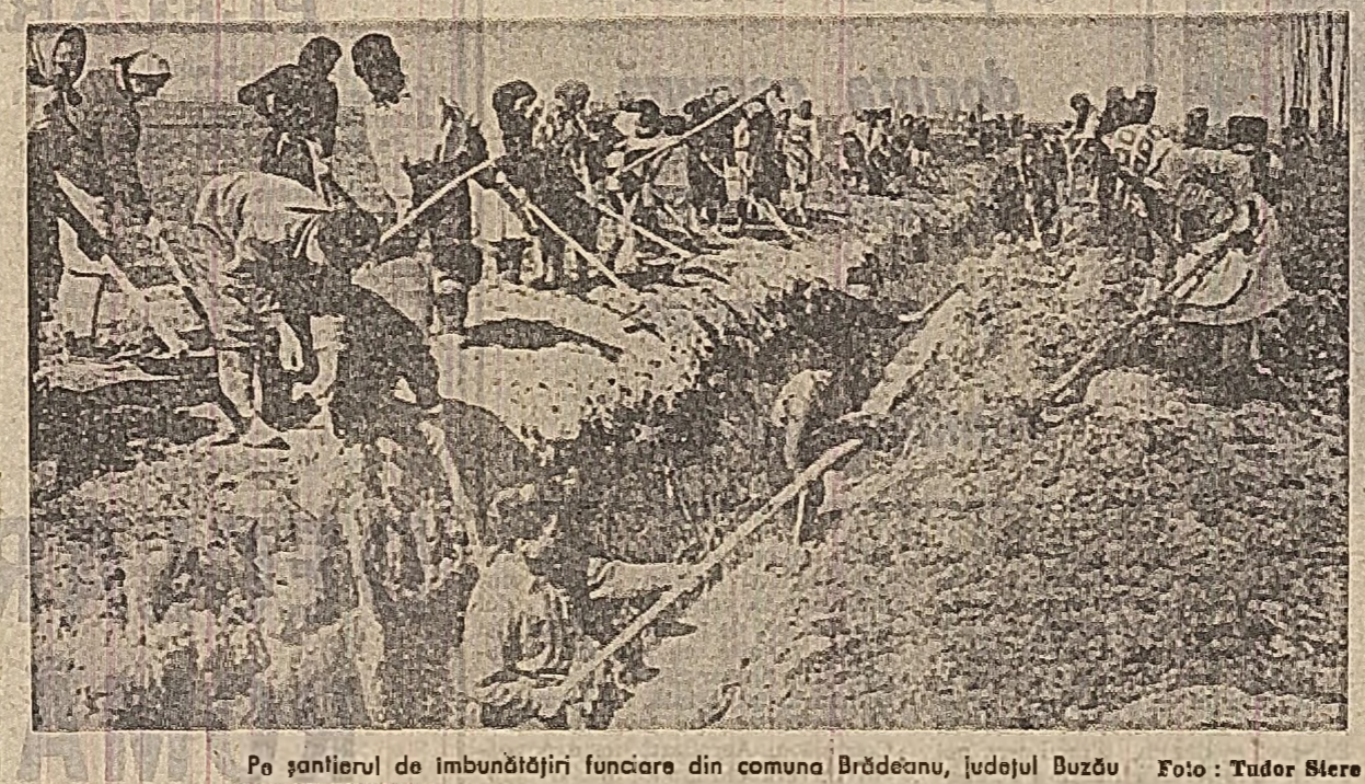
Pe șantierul de îmbunătățiri funciare din comuna Brădeanu, județul Buzău.