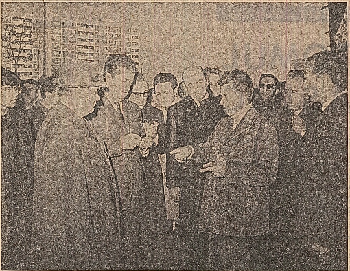
Primul vicepreședinte al consiliului popular municipal are ce nota