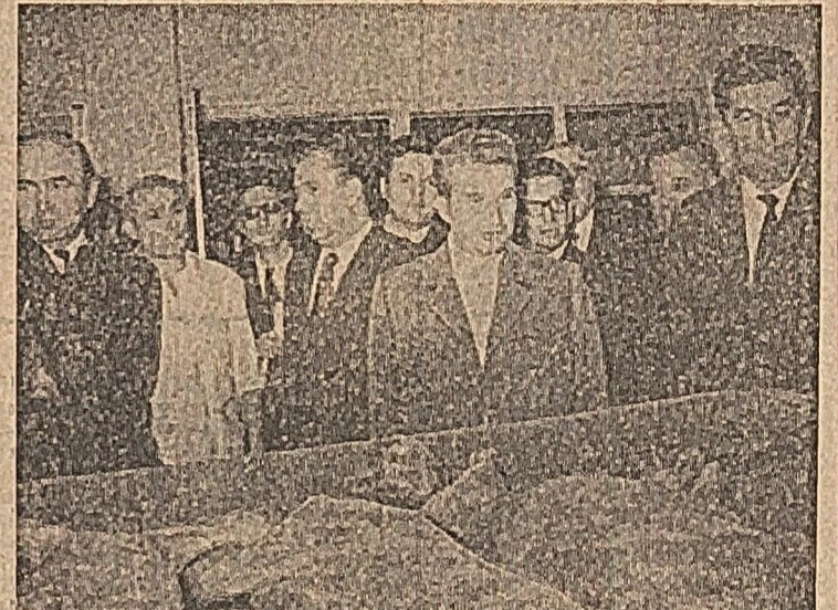
În Piața Unirii: Aprovizionarea e bună. Dar nu și modul de expunere a produselor