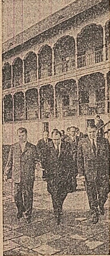
Cu mai multă fonzie, această curte poate fi transformată într-o atractivă grădini-restauran

Prețutînd, în aceste unități care și prin numele lor — „Strățara de aur”, „Silul”, „Amintiri”, „Interiorul”, „Metalul” etc. —