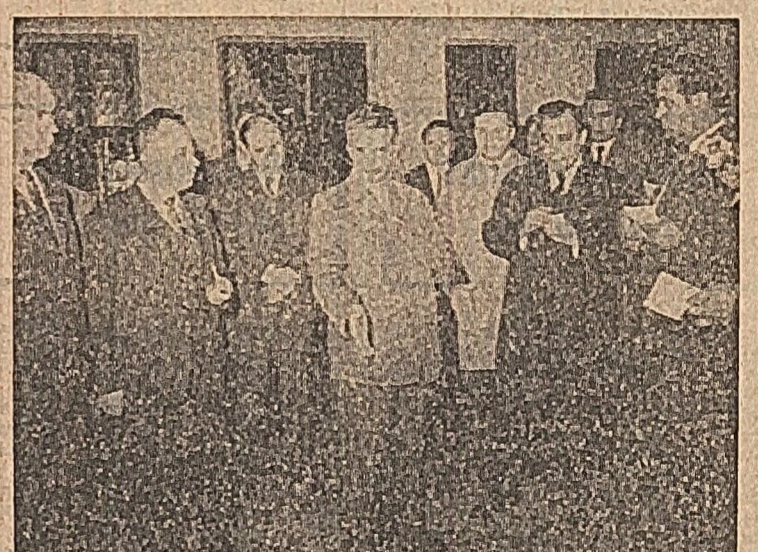
La „Manul lui Manuc”: Multe lucruri frumoase aici. Dar de ce se irosește acest spațiu? Să faceți din el încă o sală de restaurant. Vom veni s-o vedem!