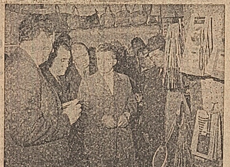
Într-un magazin de articole casnice: Progrese evidente pe care le considerăm doar un început