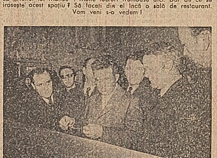
Isucșina meșteșugarilor — apreciată într-un nou magazin de obiecte de artă