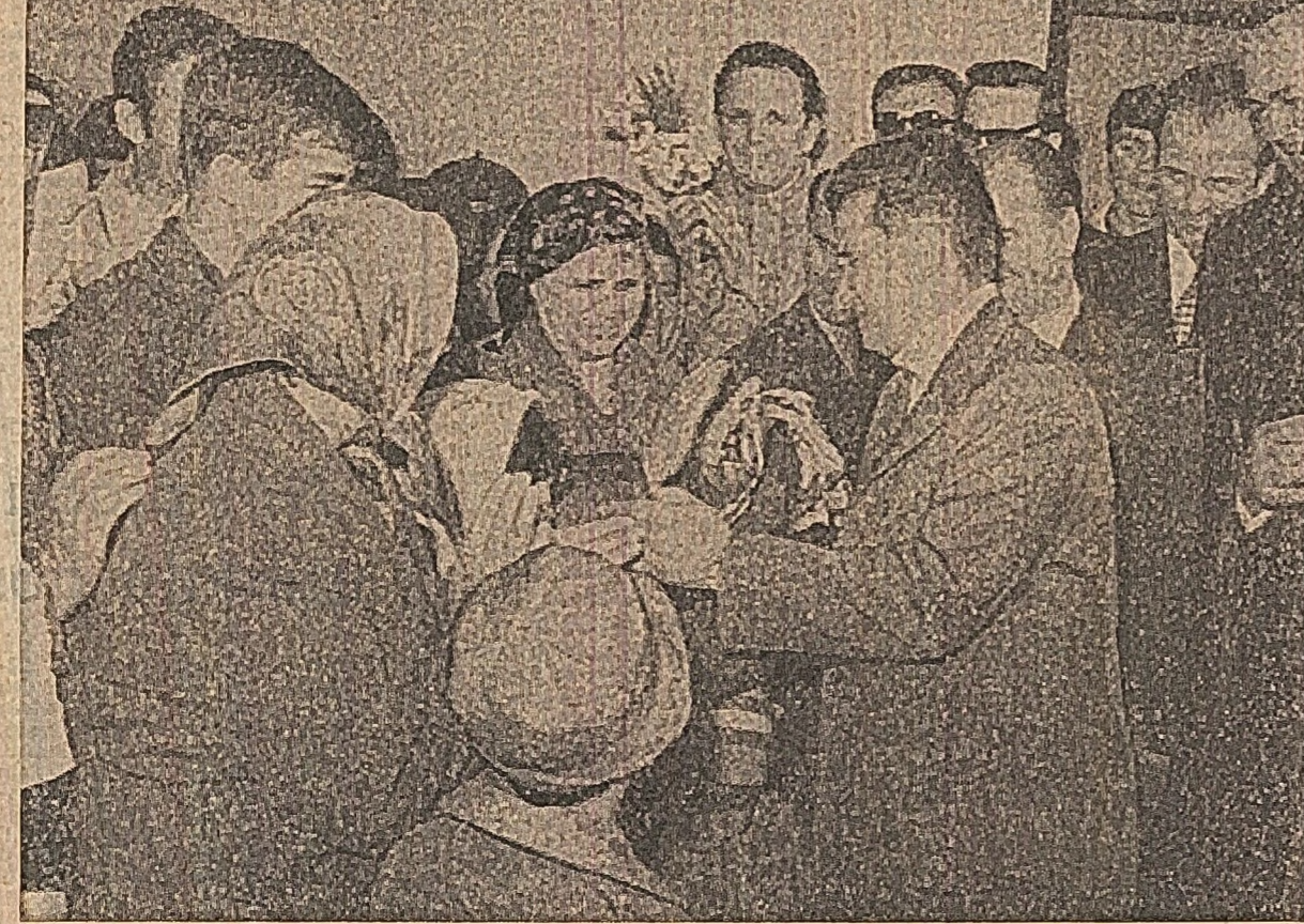
Președintele, cu aceeași dragoste: „Bine ați venit între noi, tovarășe Ceaușescu!”