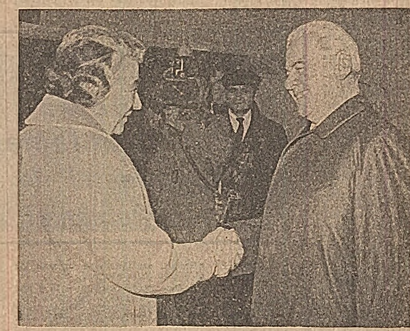
La sosire pe aeroportul Otopeni

Președintele Consiliului de Miniștri, tovarășul Ion Gheorghe Maurer, a salutată cordial pe premierul Israelului, dna Golda Meir, la coborrea sa din avion. Erau prezenți Corneliu Mănescu, ministrul afacerilor externe, George Macoveșcu, prim-adjunct, precum și Ion Covaș, ambasadorul României în Israel.