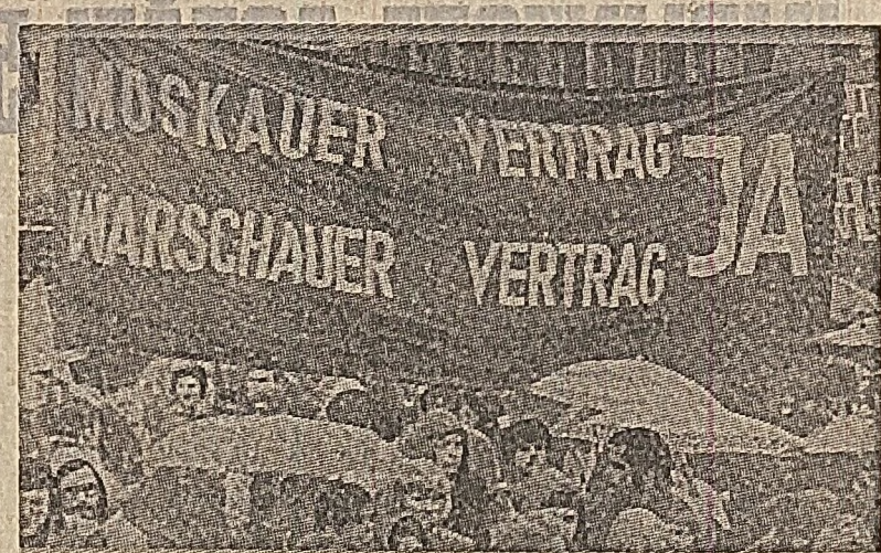
R. F. a Germaniei. Demonstrație la Stuttgart în sprijinul ratificării tratatelor încheiate de R.F.G. cu U.R.S.S. și Polonia

OTTAWA 7 (Agerpres). — Guvernul Canadei a prezentat parlamentului un proiect de lege privind limitarea și controlul investițiilor de capital străin în industria țării. Textul proiectului de lege a fost prezentat în parlament și publicat și o dată de seamă din care rezultă că, în industria prelucrătoare societățile străine dispun de 60 la sută din capitalul în industria de extractie și prelucrare a petrolului, controlul străin se extinde asupra a 90 la sută din capacitățile de producție, iar în industria extractivă și metalurgică, capitalul străin reprezintă 60 la sută. Documentul menționează, de asemenea, că din totalul investițiilor străine în Canada, circa 80 la sută provin din S.U.A.