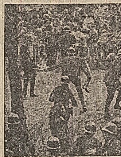
Demonstrația de studenți de la Universitatea Columbia din New York împotriva raidurilor de bombardament ale aviației americane asupra R. D. Vietnam. Polijia a intervenit cu brutalitate, oprimând un număr de arestări.

asupra Vietnamului de nord. Guvernul R. D. Vietnam, se subliniază în declarație, cere ca administratia S.U.A. să pună capăt imediat și definitiv bombardamentelor și tuturor actelor care încalcă suveranitatea și securitatea R. D. Vietnam.