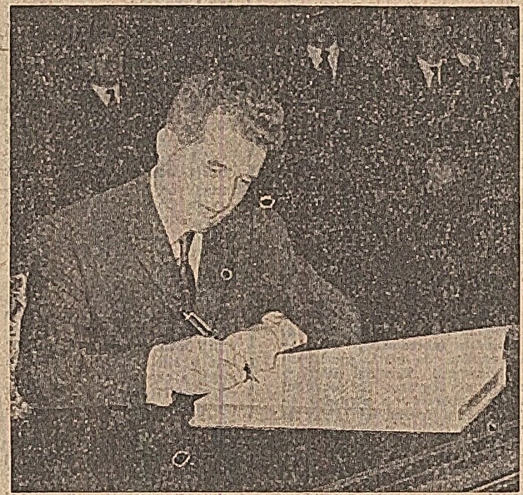
Semnind în Cartea de onoare a muzeului