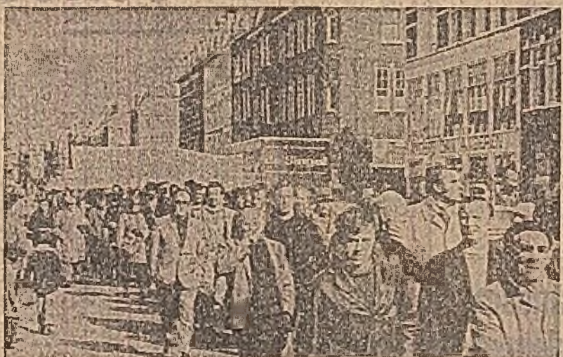
Olanda. Demonstrația muncitorească la Amsterdam împotriva creșterii salariului, pentru îmbunătățirea condițiilor de salarizare și de muncă

Înfruntarea lui I.T.T. — gigantul monopolist, care în toamna anului 1970 puse la cale complotul, esuă, destinată să blocheze accesul la putere al guvernului Unității Populare — nu este, în ultimă instanță, o replică a guvernului, ci, înainte de toate, o continuare curajoasă a politicii de naționalizare, de întărire a securității de stat din economia națională. Presiunile externe tind să frâneze acțiunile politice — refuzarea unor credite, intervențiile S.U.A. în organismele bancare — internaționale pentru împiedicarea acordării de împrumuturi către Chile, embargo al aerului unor bunuri chilene în cererea monopolului Anaconda — au creat dificultăți, unele din ele chiar serioase, dar nu au determinat renunțarea nici măcar parțială la programul de naționalizare. Dimotivă, o se înduce în viață prin aplicarea cu fidelitate a obiectivelor urmării. A curat, totodată, campania propagandistică a forțelor castile transformării din Chile, care au încercat să creeze, în exterior, o imagine deformată a situației economice din Chile, acționând în direcția de a crea, în rândul populației din Chile, o imagine de naționalizator. Dar încă, această propagandă își permite să nu arbitră să năde cifrele creșterii economice, nu-i este de folos la îndemână să procedeze la fel cu studiile comparative ale O.N.U. Într-un docu-