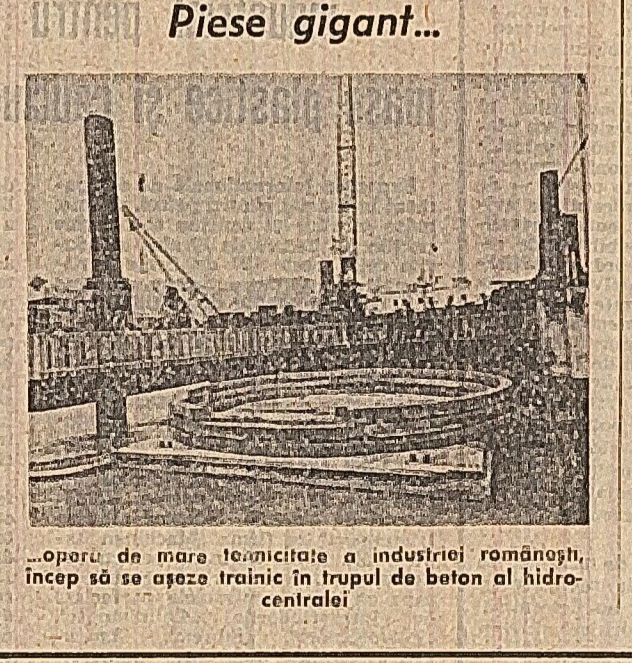
Piese gigant... — opera de mare teamăritate a industriei românești, încep să se așeze tramic în trupul de beton al hidrocentralei