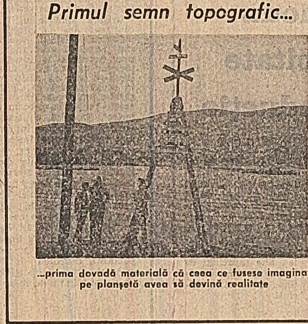
Primul semn topografic... — prima dovadă materială că ceea ce fusese imaginat pe planșetă avea să devină realitate

S ovet. Am simțit în clipa de răgaz a acestui tînar constructor urșaga seto de odihnă a întregului santer, a întregului sistem energetic nou-născut.