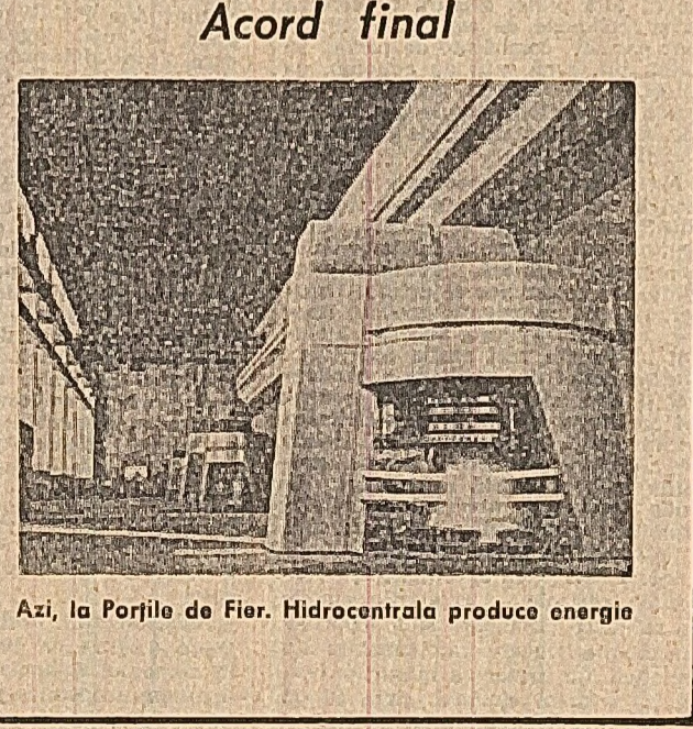
Acord final... Azi, la Porțile de Fier, Hidrocentrala produce energie