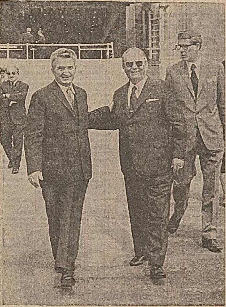
În timpul întâlnirii tovarășilor Nicolae Ceaușescu și Josip Broz Tito