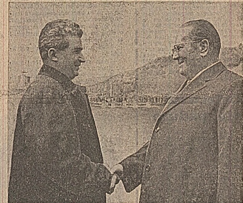
La Orșova, un călduros rămas bun

Cazane cu aproape două milenii în urmă, se înfățișează ochiului în ipostaza ei originală, cu toate că astăzi ea se află cu aproximativ 30