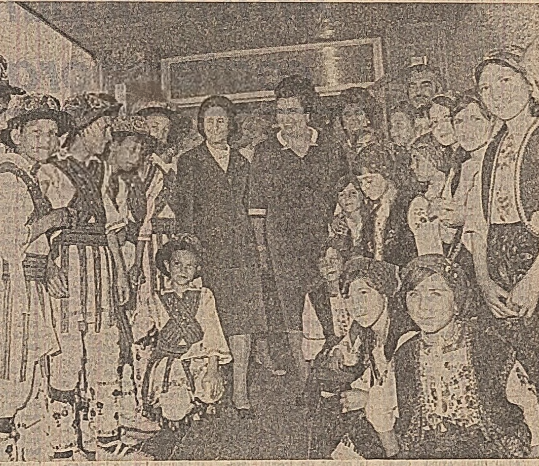
La Kladovo, în mijlocul elevilor gimnaziului „25 Mai”

Reprezentanții guvernelor țărilor membre ale Comisiei Dunării, care, la invitația guvernului Republicii Socialiste România și a guvernului Republicii Socialiste Federative Iugoslavă au luat parte la festivitățile prilejuite de inaugurarea Sistemului hidroenergetic și de navigație Porțile de Fier, au făcut miercuri o vizită în municipiul Drobeta Turnu-Severin, la hidrocentrala de